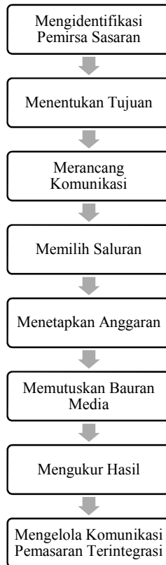
Gambar 1.2 Langkah-langkah Dalam Mengembangkan Komunikasi Efektif (Kotler & Keller, 2009:179)