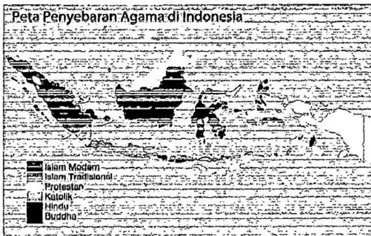
Gambar 1.1 Peta Penyebaran Agama di Indonesia

Berdasarkan laporan Pew Forum On Religion and Public life setelah melakukan penelitian survei dari 232 negara di seluruh dunia tercatat Indonesia menempati peringkat pertama dengan jumlah muslim terbesar di seluruh dunia yaitu sebanyak 202.867.000 jiwa 1 dan di susul kemudian sama Pakistan di posisi kedua, india di posisi ketiga dan Bangladesh di posisi ke empat. Di Indonesia juga agama islam merupakan agama mayoritas. ini terbukti dari data yang saya kutip di wikevidia pada 2010 kira-kira 85% dari 240.271.522 penduduk Indonesia adalah pemeluk agama islam 9,2% Protestan, 3,5 Katolik, 1,8% hindu dan 0,4% Buddha. 2