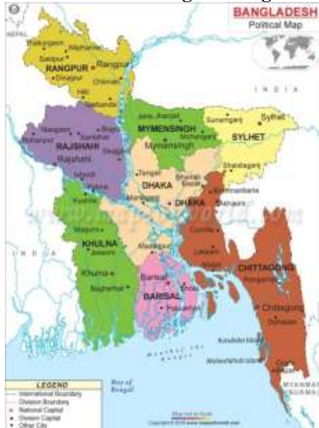
Gambar 3.1. Peta Negara Bangladesh

perbankan. Negara ini memiliki lebih dari 60 perusahaan milik negara, di berbagai bidang yang seperti manufaktur, pertanian, transportasi dan komunikasi, diidentifikasi untuk divestasi, tetapi kemajuannya lambat karena oposisi populer yang kuat (Commonwealth, 2018).