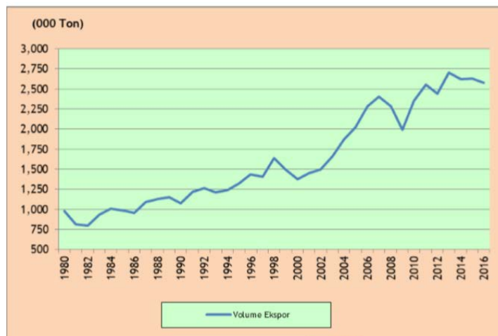
Gambar 1 1 Volume Ekspor

perdagangan internasional. Komoditi ini juga memberikan kontribusi yang signifikan terhadap sumber devisa Negara. Indonesia adalah salah satu produsen karet terbesar disamping Malaysia dan Thailand, komoditas ini juga memberikan kontribusi dalam upaya meningkatkan pertumbuhan devisa. Berikut grafik volume ekspor karet Indonesia dari tahun 1980-2016.