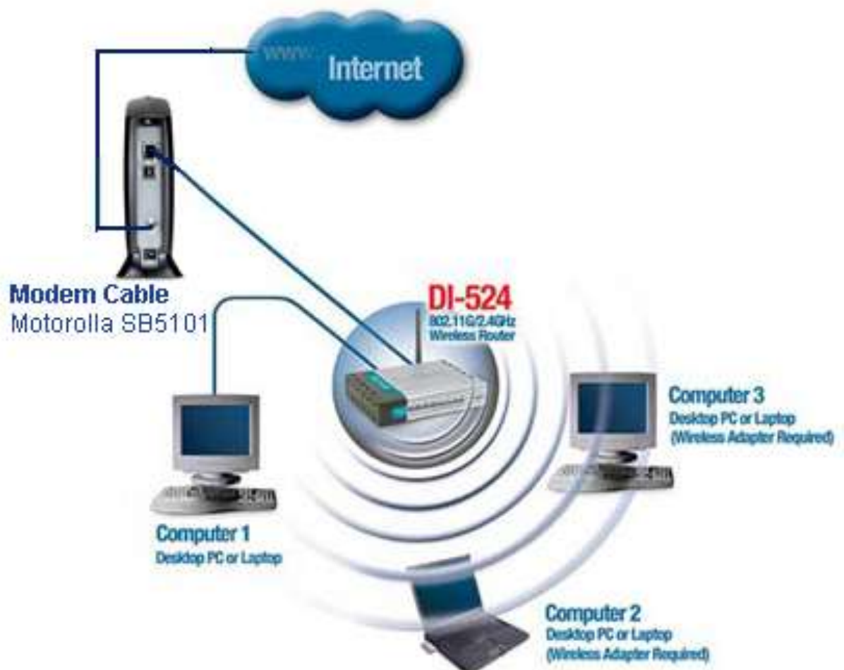
Gambar 2.1 Cara koneksi Internet

Sedangkan pengertian internet menurut segi ilmu pengetahuan, internet adalah sebuah perpustakaan besar yang didalamnya terdapat jutaan (bahkan milyaran) informasi atau data yang dapat berupa teks, grafik, audio maupun animasi dan lain lain dalam bentuk media elektronik. Semua orang bisa berkunjung ke perpustakaan tersebut kapan saja serta dari mana saja, jika dilihat dari segi komunikasi, internet adalah sarana yang sangat efektif dan efisien untuk melakukan pertukaran informasi jarak jauh maupun jarak dekat, seperti di dalam lingkungan perkantoran, tempat pendidikan, ataupun instansi terkait.