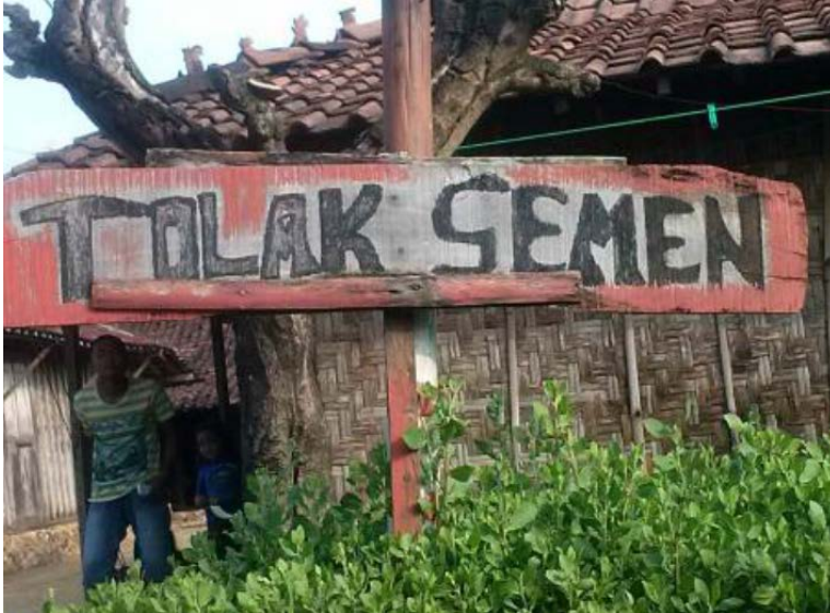
Bersumber: Dokumentasi Bocah Angon Pecinta Pegunungan Kendeng