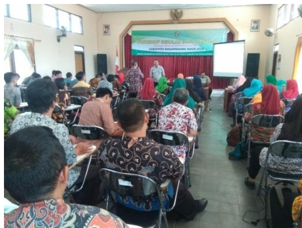
Gambar 3.5 Workshop Kebencanaan bagi Guru SMP se- Kabupaten Banjarnegara Tahun 2018

Sekolah dan Guru jenjang SMP. Setiap sekolah wajib mengirimkan satu (1) perwakilan guru atau staffnya untuk mengikuti pelatihan dan workshop yang diselenggarakan oleh Dindikpora dan BPBD Banjarnegara. Pelatihan dan workshop yang diikuti oleh guru SMP se-Kabupaten Banjarnegara ini dilaksanakan selama 3 hari dengan agenda mengupas buku pintar sekolah tangguh bencana. Pelatihan tersebut bertujuan untuk mengenalkan pendidikan kebencanaan bagi guru yang nantinya ilmu yang diperoleh ditularkan langsung ke siswanya. Materi yang diberikan pada saat pelatihan adalah pengenalan resiko bencana, cara evakuasi mandiri, cara menghadapi bencana, dan lain-lain. Disamping pemaparan materi berupa ceramah dan diskusi, ditengah materi juga diselengi simulasi kebencanaan.