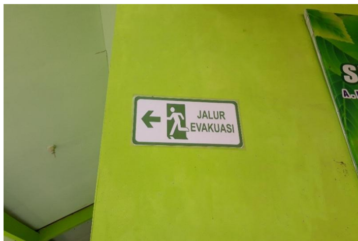
Gambar 3.2 Rambu Jalur Evakuasi di SMP Negeri 1 Karangobar

sekolah. Hasil observasi yang di lapangan menunjukkan bahwa dari 4 lokasi SMP yang sudah dikunjungi, terdapat 2 sekolah dengan rambu jalur evakuasi dan titik kumpul belum terpasang, yakni SMP Negeri 1 Wanayasa dan SMP Ma'arif NU 01 Karangobar. Di samping itu, meski rambu jalur evakuasi yang terdapat di SMP Negeri 1 Batur sudah terpasang, namun beberapa diantaranya terlepas akibat adanya angin kencang pada bulan Januari 2019 lalu. Berikut penampakan rambu jalur evakuasi yang terpasang di sekolah-sekolah: