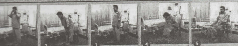
1. Berdiri tegak 2. Takbiratul Ibrahm / Ruku' / Rukuk 3. Ruku' / Rukuk 4. Sujud / Sujud 5. Duduk antara dua sujud / duduk tasyahhud

PESAKIT YANG MAMPU SOLAT BERDIRI TETAPI TIDAK MAMPU RUKU' DAN SUJUD SEPERTI BIASA