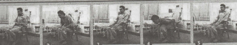
1. Berdiri tegak 2. Takbiratul Ibrahm / Ruku' / Rukuk 3. Ruku' / Rukuk 4. Sujud / Sujud 5. Duduk antara dua sujud / duduk tasyahhud

PESAKIT YANG TIDAK MAMPU SOLAT BERDIRI DAN MAMPU SOLAT DUDUK (DI ATAS KERUSI)