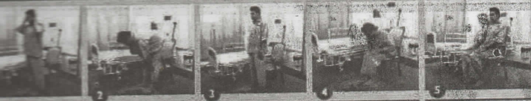
1. Berdiri tegak 2. Takbiratul Ibrahm / Ruku' / Rukuk 3. Ruku' / Rukuk 4. Sujud / Sujud 5. Duduk antara dua sujud / duduk tasyahhud

PESAKIT YANG MAMPU SOLAT BERDIRI DAN MAMPU RUKU' TETAPI TIDAK MAMPU SUJUD SEPERTI BIASA