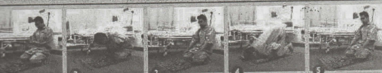
1. Berdiri tegak 2. Takbiratul Ibrahm / Ruku' / Rukuk 3. Ruku' / Rukuk 4. Sujud / Sujud 5. Duduk antara dua sujud / duduk tasyahhud

PESAKIT YANG TIDAK MAMPU SOLAT BERDIRI DAN MAMPU SOLAT DUDUK (DUDUK IFTIRASY)