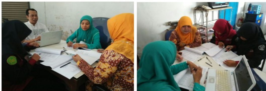
Gambar 1. Pelatihan Logika Dasar Akuntansi

Berdasarkan identifikasi dari hasil diskusi dengan para pengelola PERUMDES Binangun Jatirejo maka dapat disusun materi pelatihan dan pendampingan sebagai berikut; (1) Logika debit-kredit, Jurnal, dan buku besar (posting ke account ), (2) Neraca Saldo, (3) Jurnal penyesuaian, (4) Laporan Rugi/Laba, Laporan Aliran Kas, Laporan Neraca. (5) Laporan Kolektibilitas dan Portofolio, (6) Analisa Laporan Keuangan (Taswan, 2008), (7) Penggunaan Aplikasi LKM dalam penyusunan laporan keuangan (Widadi & Parwoto, 2016)