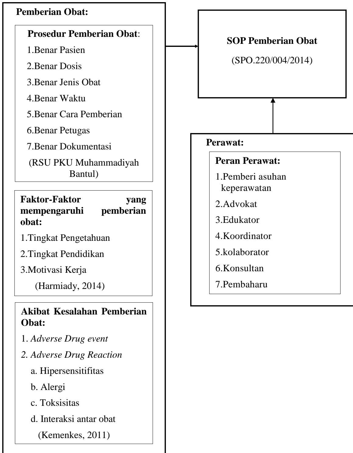
Gambar 1 Kerangka Teori