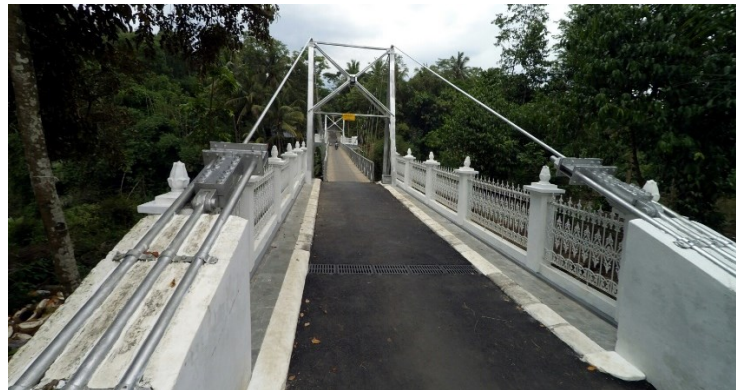
Gambar 3. Jembatan Duwet