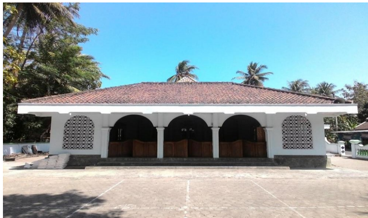
Gambar 2. Tampak depan Masjid Trayu, Galur