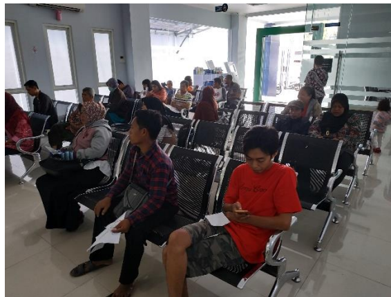
Peserta BPJS Kesehatan