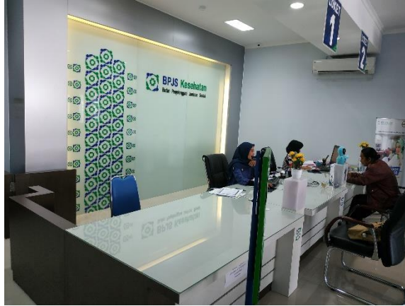
Pelayanan BPJS Kesehatan