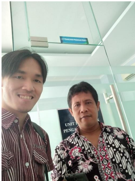
Wawancara dengan Peserta BPJS Kesehatan Kabupaten Kulon Progo