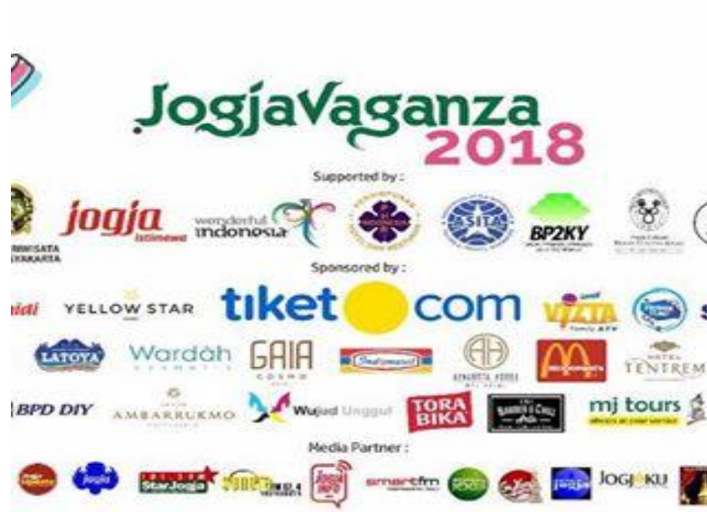
Gambar 1.3 : Logo event