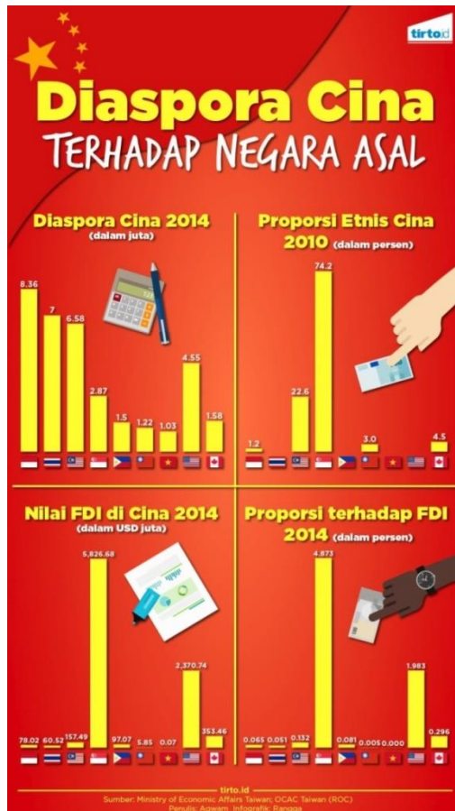
Gambar 3.2. persentase diaspora China di berbagai negara beserta jumlah FDI negara tersebut terhadap China