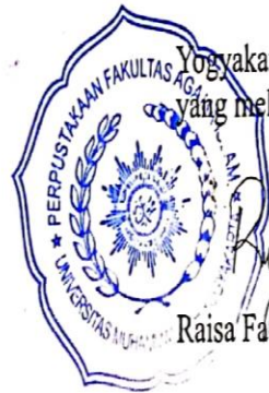
Laela Niswatin, S.I.Pust.

Yogyakarta, 2019-03-01 Yang melaksanakan pengecekan