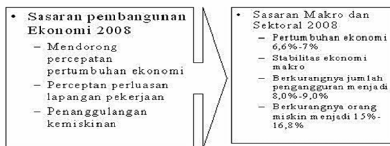
Gambar 2. Pembangunan Ekonomi Nasional 2008

kinan. 6 Selain itu, mendukung 11 program prioritas pembangunan nasional jangka menengah antara lain: reformasi birokrasi dan tata kelola; pendidikan; kesehatan; penanggulangan kemiskinan; ketahanan pangan; infrastruktur; iklim investasi dan usaha; energi; lingkungan hidup dan pengelolaan bencana; pembangunan daerah tertinggal, terdepan, terluar, pasca konflik; kebudayaan; kreativitas dan inovasi teknologi. 7