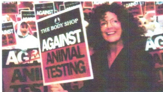
Gambar 2. Kampanye The Body Shop Sumber: lipstiq.com, diakses pada 4 Desember 2018 pada pukul 21.00 PM

Corporate image yang dibentuk adalah Enrich not Exploit, The Body Shop berusaha mengkolaborasi isu sosial dengan menyusun kampanye dengan perencanaan dan pelaksanaan yang tertata dengan baik. Program no animal testing masih berlanjut ( sustain ) dilakukan hingga saat ini, tidak mengherankan jika The Body Shop memiliki pelanggan setia yang percaya akan corporate image dari perusahaan. Tidak lepas dari hal ini, peran Anita Roddick sangat besar selaku founder dari The Body Shop yang juga berhasil merepresentasikan melalui personal brand yang dimilikinya.