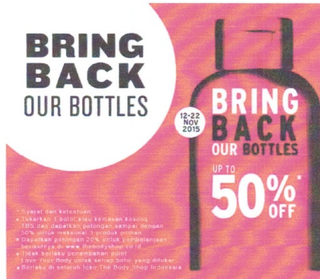
Gambar 5: Campaign atau poster BBOB The Body Shop

Program ini selain berhasil meningkatkan angka penjualan produk The Body Shop juga menghasilkan berbagai penghargaan dari berbagai belahan dunia. Di Indonesia sendiri The Body Shop berhasil mendapatkan penghargaan dari Kementerian Lingkungan Hidup dan Kehutanan Republik Indonesia atas inisiatif dalam pengurangan sampah ( Waste Reduction Initiative ). Hal ini semakin memperkuat eksistensi The Body Shop sebagai perusahaan yang ramah lingkungan.