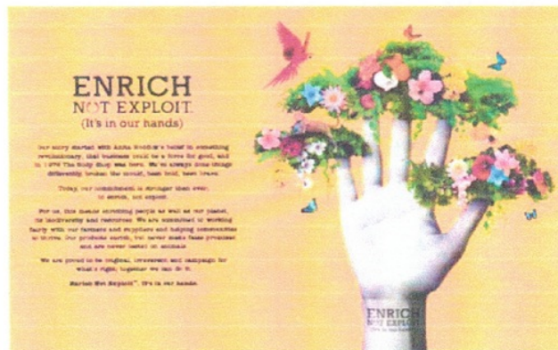
Gambar 3. Kampanye The Body shop