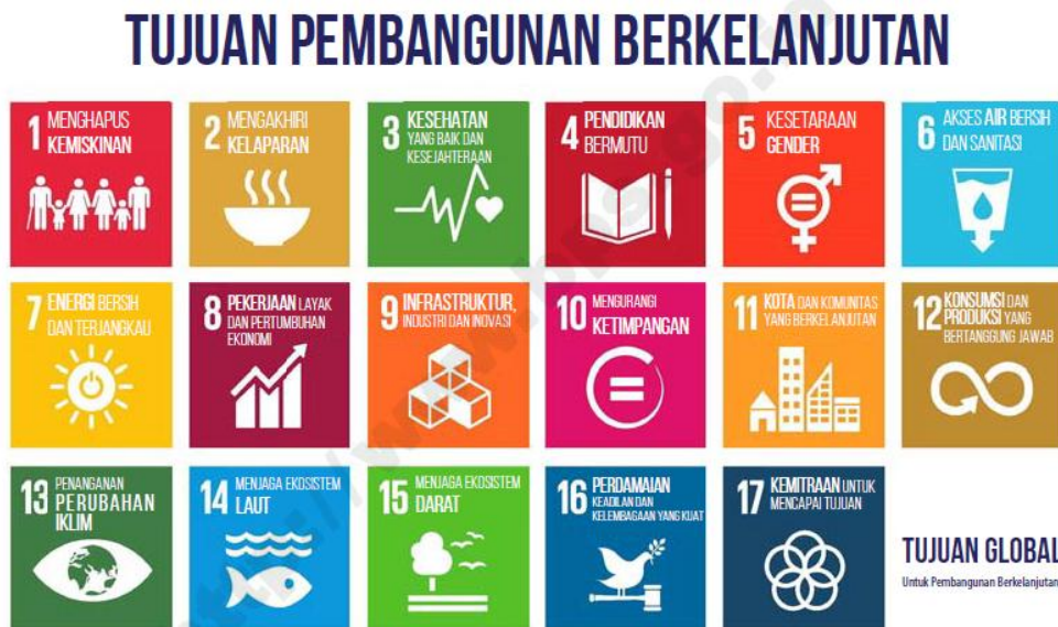
Gambar 1.1 Ilustrasi 17 Tujuan Pembangunan Berkelanjutan