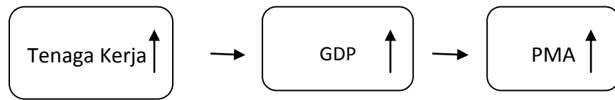
Gambar 5. 3 Pengaruh Tenaga Kreja Terhadap PMA

Hal ini sesuai dengan teori dalam bab2 sehingga teori tersebut dapat diterima. Semakin derasnya arus Penanaman Modal Asing maka akan menciptakan lapangan pekerjaan yang bertujuan untuk mengurangi tingkat pengangguran dan menaikkan tingkat tenaga kerja. Menurut Sukirno (2007) kegiatan investasi memungkinkan suatu masyarakat untuk terus menerus meningkatkan kegiatan ekonomi dan kesempatan kerja, Meningkatkan pendapatan nasional dan meningkatkan taraf kemakmuran masyarakat. Sehingga dapat dijelaskan bahwa tenaga kerja dan Penanaman Modal Asing memiliki pengaruh positif dan signifikan, maka dalam hal ini penanaman modal asing sangat penting bagi pertumbuhan ekonomi di suatu daerah karna dapat mengurangi pengangguran sehingga secara otomatis produk yang diciptakan akan bertambah. Hasil penelitian ini didukung oleh Tambunan dkk(2015) yang menyatakan bahwa secara simultan tenaga kerja berpengaruh positif dan signifikan terhadap Penanaman Modal Asing. Hasil positif dan signifikan menjelaskan bahwa derasnya arus modal asing akan membawa dampak positif bagi pertumbuhan ekonomi sehingga banyaknya peluang untuk menciptakan pekerjaan dan sehingga dapat mengurangi tingkat pengangguran. pertumbuhan penduduk dan pertumbuhan Angkatan kerja dianggap