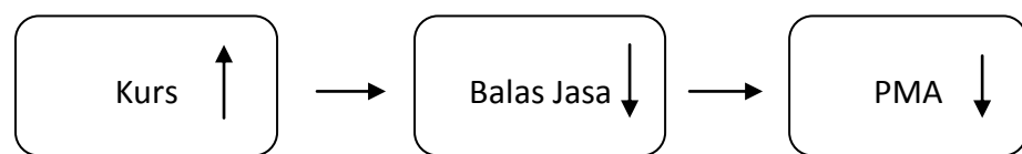
Gambar 5. 2 Pengaruh Kurs terhadap PMA

perubahan pada Penanaman Modal Asing (PMA) sebesar -1.016651. karena nilai koefisien pada jangka panjang adalah negatif dengan nilai probabilitas lebih kecil dari 0,05 dan pada jangka pendek adalah negatif dengan nilai probabilitas lebih besar dari 0,05, maka dapat dijelaskan bahwa perubahan Kurs rupiah hanya berpengaruh terhadap perubahan variabel Penanaman Modal Asing (PMA) dalam jangka panjang dengan nilai probabilitas 0,0030, dengan demikian hipotesis yang diajukan bahwa Kurs rupiah berpengaruh negatif dan signifikan terhadap Penanaman Modal Asing (PMA) diterima.