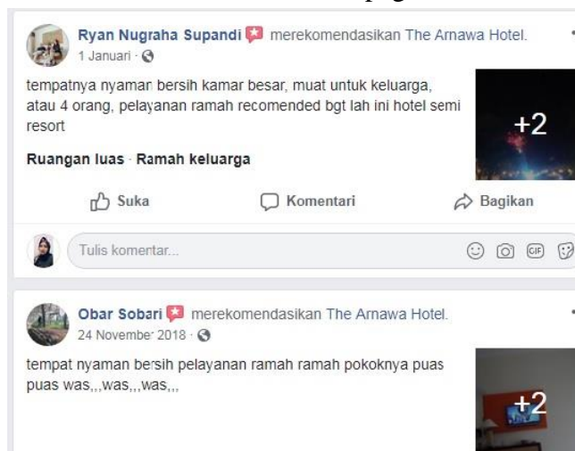
Gambar 1.4 Review 2018 melalui Facebook Fanpage The Arnawa Hotel