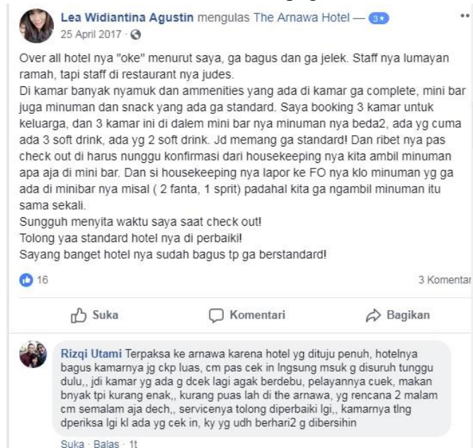
Gambar 1.1 Review 2017 melalui facebook fanpage The Arnawa Hotel