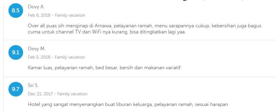
Gambar 1.5 Review 2018 melalui Online Travel Agent (Traveloka)

pada komentar-komentar yang masuk dari para tamu, karena sudah jarang ditemukan komentar-komentar seperti tahun 2017 lalu. Di komentar yang masuk tahun 2018, banyak komentar yang baik seperti pelayanan yang ramah, kemudian juga tempat yang bersih dan yang lainnya.