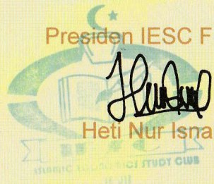
Heti Nur Isnaini