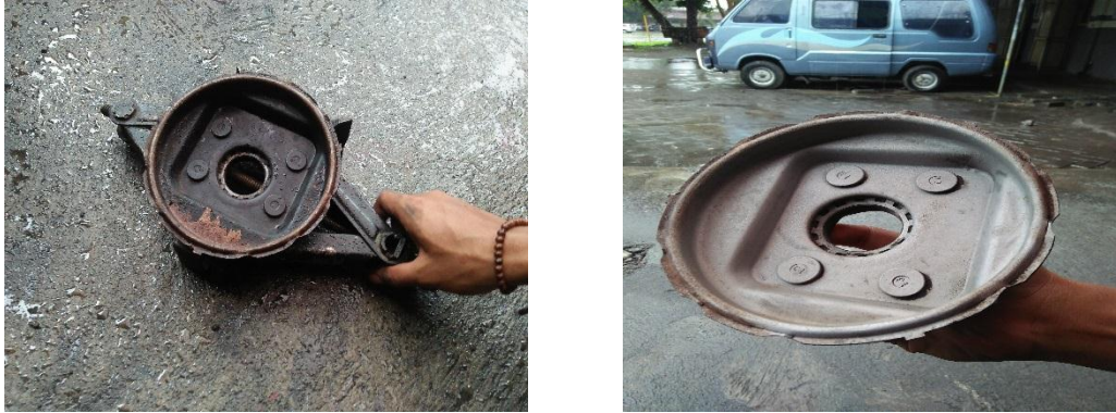
Gambar 1.1 Hasil sebelum dan sesudah proses sandblasting