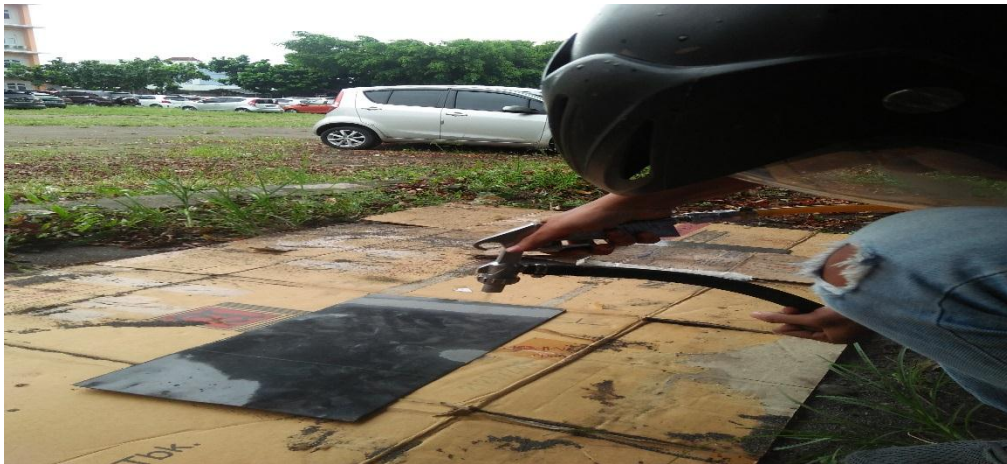
Gambar 1.2 proses sandblasting