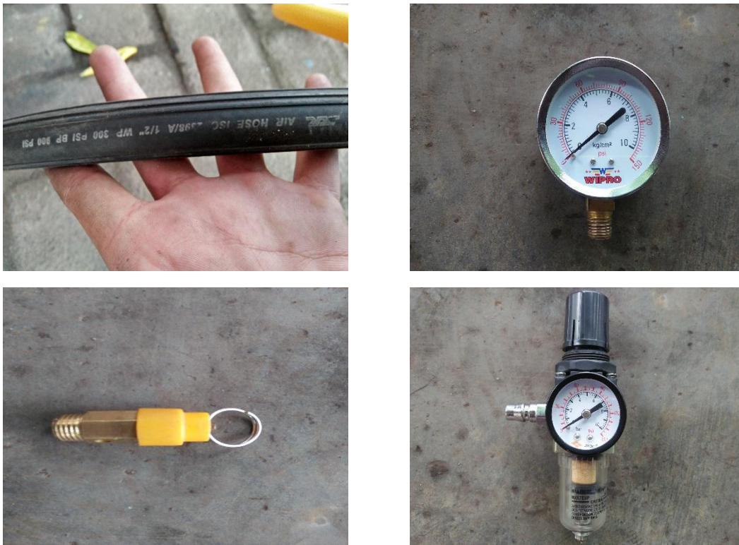
Gambar 1.3 Komponen-komponen sandblasting