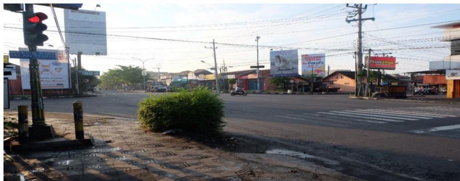
Gambar 3.3 Simpang Taman Siswa