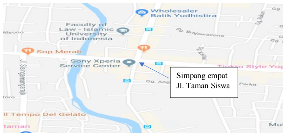
Gambar 3.2 Lokasi Penelitian

Penelitian ini terletak di simpangan bersinyal Tamsis wirogunan yogyakarta (Jl. Menteri Supeno - Jl. Kolonel Sugiyono - Jl. Lowanu - Jl. Taman Siswa) Yogyakarta, lokasi penelitian lebih jelasnya dapat dilihat pada Gambar 3.2.