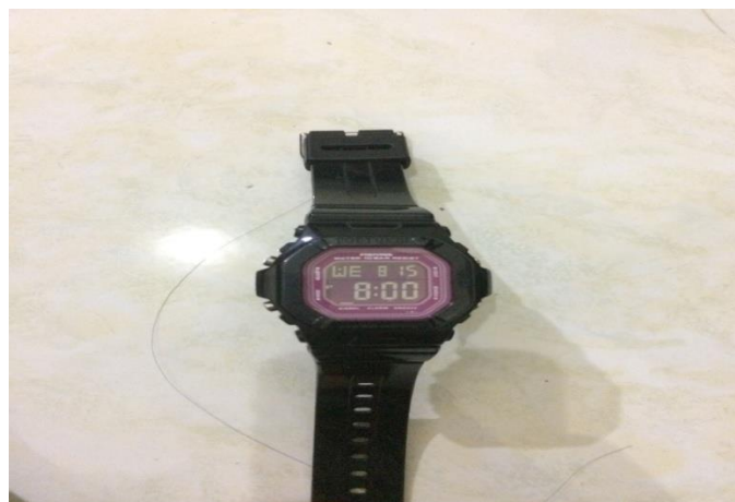
Gambar 3.6 Jam Tangan