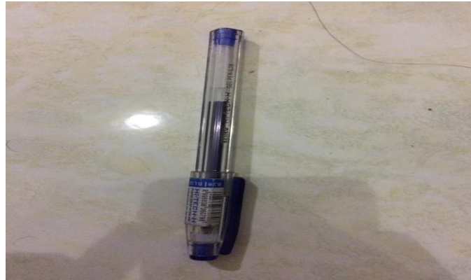
Gambar 3.4 Pena