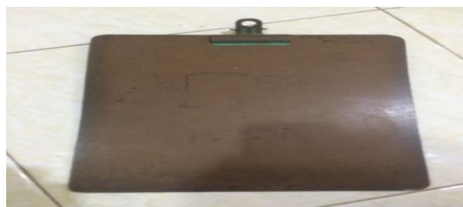
Gambar 3.3 Papan Alat Tulis