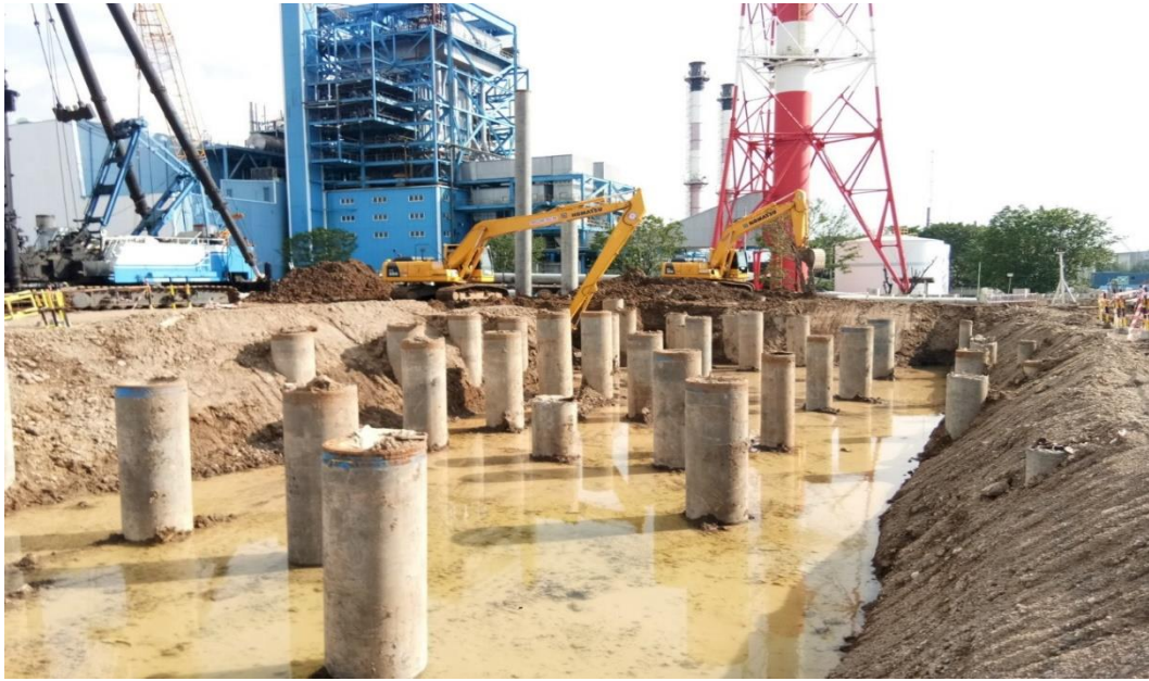
Lampiran 1. Dokumentasi Lokasi