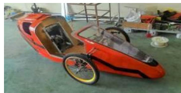
Gambar 1.2. Kategori prototype (Hakim dkk, 2015)

Kategori prototype yaitu rancangan kendaraan fokus pada desain yang aerodinamis dan simple. Konsep rancangan kendaraan ini yaitu memiliki dua roda di depan sebagai pengarah laju dan satu roda di belakang sebagai penggerak. Kategori prototype seperti ditunjukkan pada Gambar 1.2