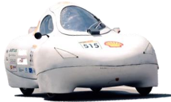
Gambar 1.3. Kategori Urban ( http://ui-smv.com )

efisien mungkin dalam penggunaan energinya. Kategori urban seperti ditunjukkan pada Gambar 1.3.