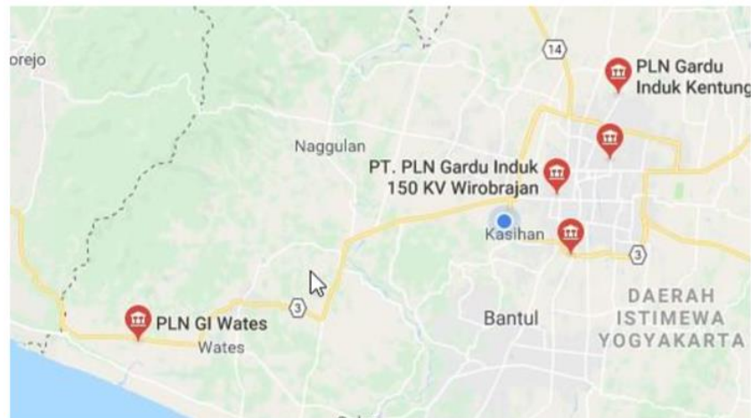
Gambar 3.2 Denah Lokasi Penelitian

Penelitian ini dilakukan pada Gardu Induk 150 KV Wates Sringkel, Plumbon, Temon, Kulon Progo, D.I. Yogyakarta, Indonesia.