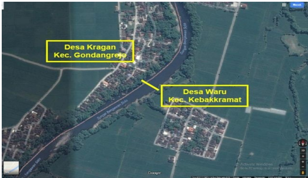
Gambar 3. 2 Peta lokasi penelitian tampak atas jembatan Kragan

Penelitian dilakukan di salah satu Jembatan Kragan sebagai penyambung dua wilayah yang terpisahkan oleh Sungai Bengawan Solo tepatnya di antara Dusun Karangwuni, Desa Kragan, Kecamatan Gondangrejo dengan Dusun Sapen, Desa Kebak, Kecamatan Kebakkramat.