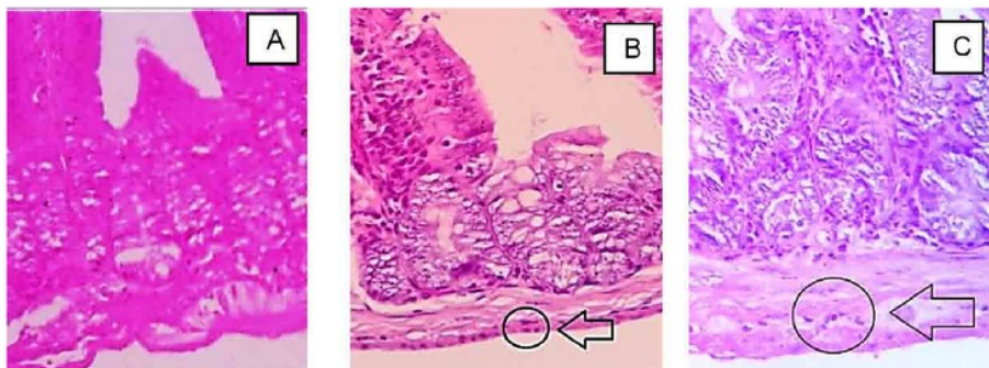
Gambar 1. Perbandingan Infiltrasi Sel Radang pada Kelompok: (A) Kontrol, Hampir Tidak Ada Infiltrasi Sel Radang (B) Ekstrak Ipomoea batatas L. Peroral dengan Dosis 0g/kgbb/hari, Infiltrasi Sel Radang Sampai ke Lapisan Muskularis Duodenum (Derajat 4) dan (C) Kelompok Kontrol Positif dengan Perlakuan Diberi Antihistamin Generasi ke-3 Peroral dengan Dosis 0.02 mg/20g bb/hari, Menunjukkan Infiltrasi Sel Radang Sampai ke Lapisan Muskularis Duodenum (Derajat 4) Gambar 2. (D) Perbandingan Infiltrasi Sel Radang pada Kelompok Dosis Ekstrak Ipomoea batatas L. 0.21g/kg bb/hari, Infiltrasi Sel Radang Sampai ke Lapisan Submukosa Duodenum (Derajat 3). (E) 0.42 g/kg bb/hari, Infiltrasi Sel Radang Sampai ke Lapisan Epitel Mukosa Duodenum dan Sedikit ke Lapisan Submukosa (Derajat 2). (F) 0.84g/kg bb/hari, Infiltrasi Sel Radang Sampai ke Lapisan Epitel Mukosa Duodenum (Derajat 1). (G) 1.65g/kg bb/hari, Infiltrasi Sel Radang Sampai ke Lapisan Submukosa Duodenum (Derajat 3)

Hasil penelitian ini membuktikan bahwa ekstrak etanol Ipomoea batatas L. mampu menurunkan derajat peradangan duodenum mencit BALB/c diinduksi ovalbumin. Semakin tinggi dosis ekstrak etanol Ipomoea batatas L. maka derajat peradangan duodenum semakin menurun dengan dosis optimal pada