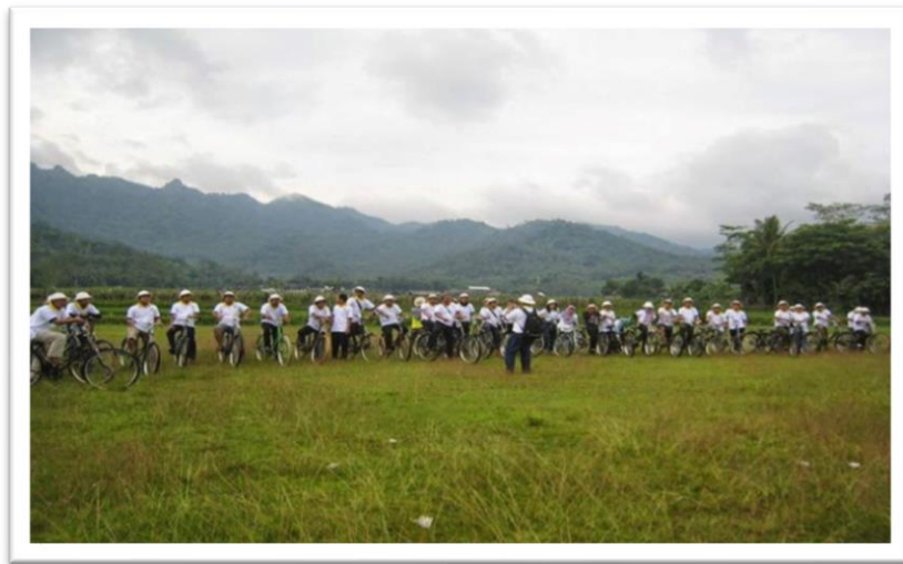
Gambar 2.2. Wisata Onthel