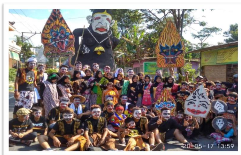
Gambar 2.8. Event Gelar Budaya Wanurejo