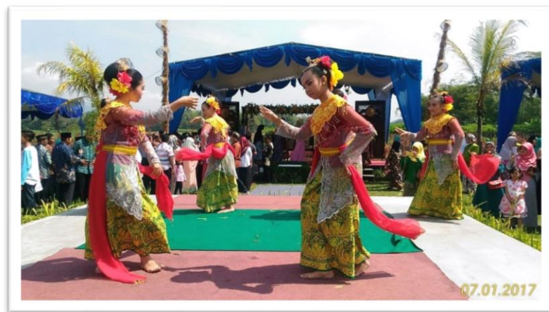
Gambar 2.4. Tari Garapan

berlokasi di Dusun Tingal. Para penari kinara-kinari ini berasal dari masyarakat Wanurejo, mereka di berikan pelatihan di sanggar tersebut.