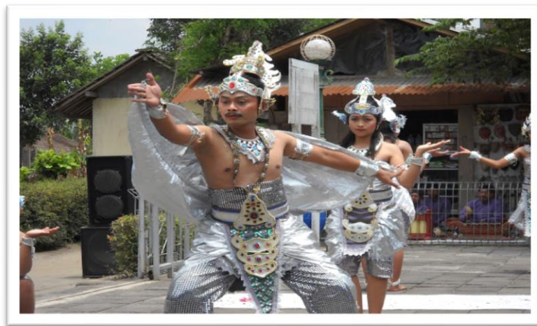
Gambar 2.3. Tari Kinara-Kinari