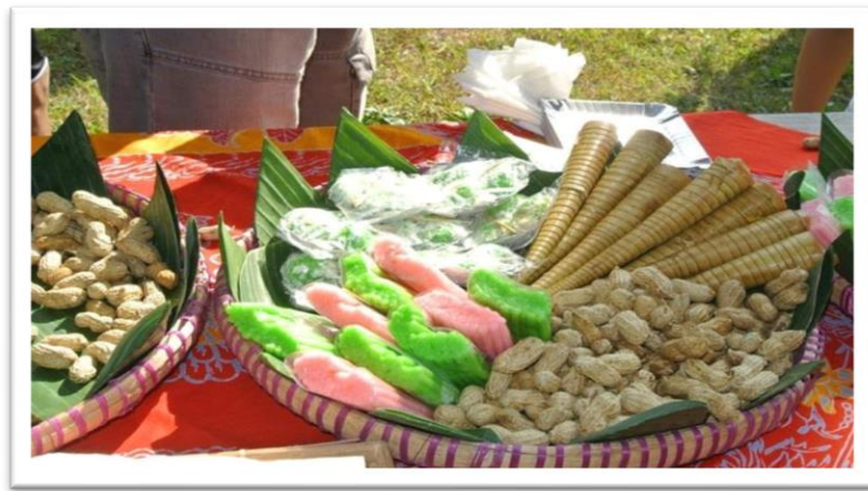
Gambar 2.5. Hasil Produk Olahan Kuliner