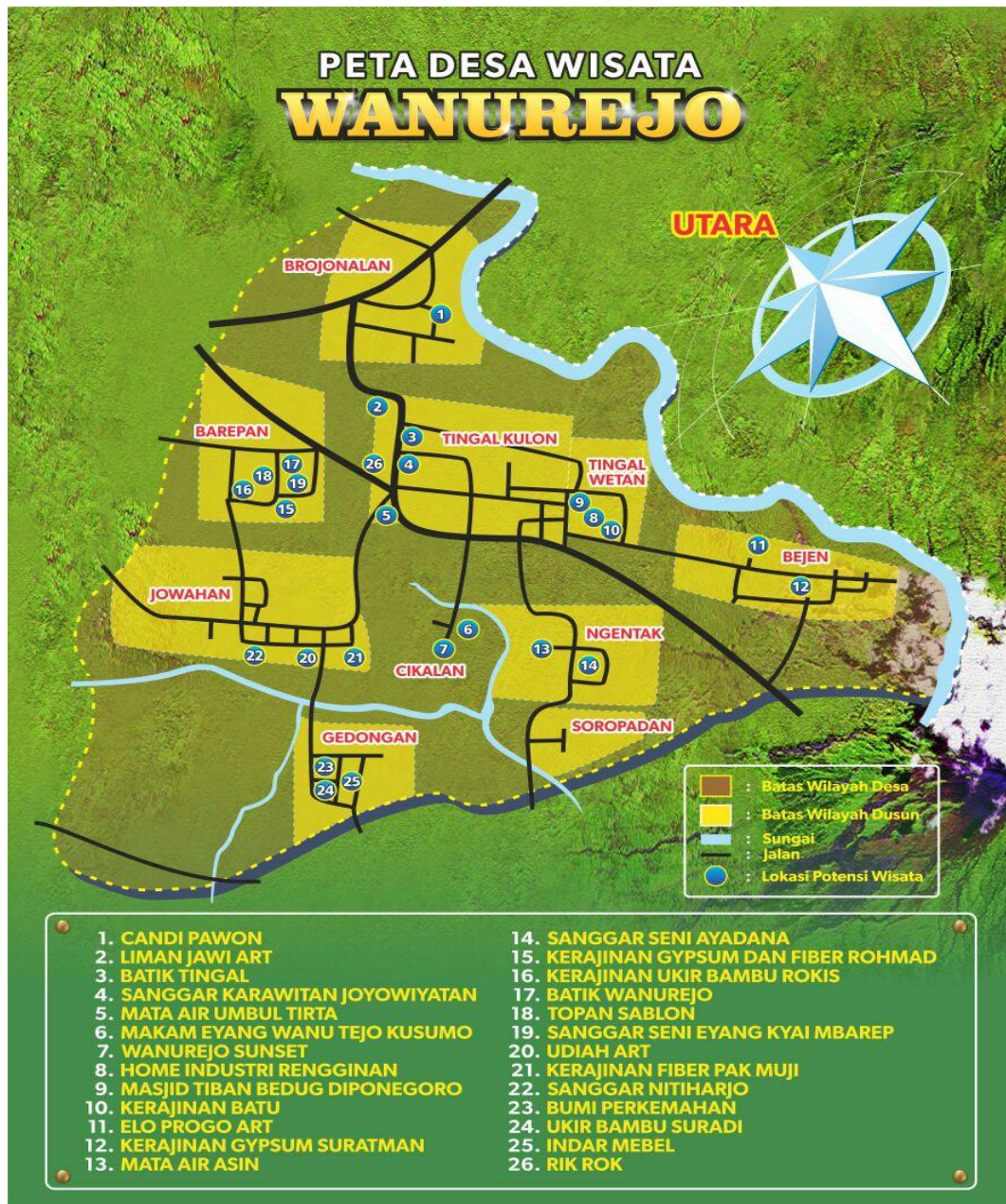
Gambar 2.10. Peta Desa Wisata Wanurejo