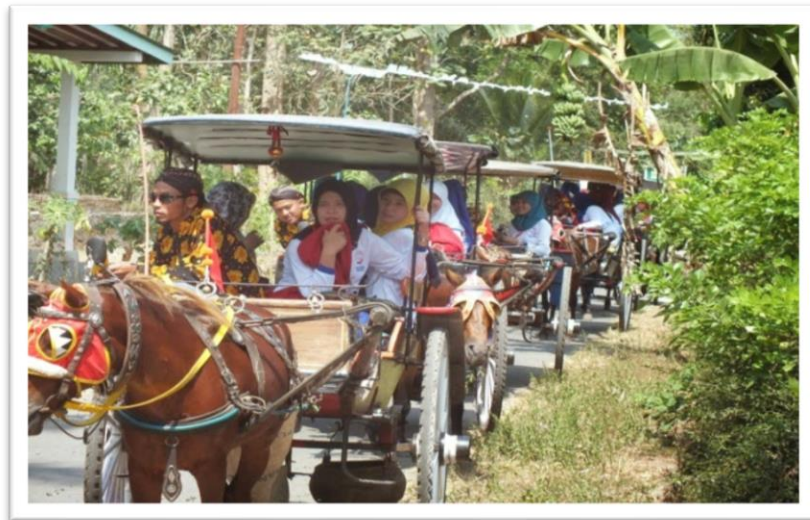
Gambar 2.1. Wisata Andong