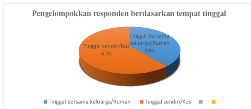
Gambar 4. 5 Pengelompokkan responden berdasarkan tempat tinggal

Pada gambar 4.5, karakteristik responden berdasarkan tempat tinggal dapat dilihat bahwa jumlah responden yang Tinggal bersama keluarga/Rumah sebanyak 39% atau 39 orang mahasiswa sedangkan responden yang tinggal sendiri/kos sebanyak 61% atau 61 orang mahasiswa.