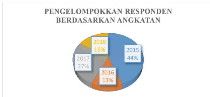
Gambar 4. 4 Pengelompokkan responden berdasarkan angkatan

Pada gambar 4.3, pengelompokkan responden berdasarkan disiplin ilmu dapat dilihat bahwa jumlah responden paling banyak berasal dari disiplin ilmu sosialis yaitu sebanyak 57% atau 57 orang mahasiswa, sedangkan responden yang berasal dari disiplin ilmu sains sebanyak 43% atau 43 orang mahasiswa.