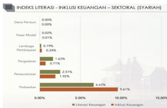
Gambar 2. 1 Indeks Literasi- Inklusi Keuangan – Sektoral (Syariah)