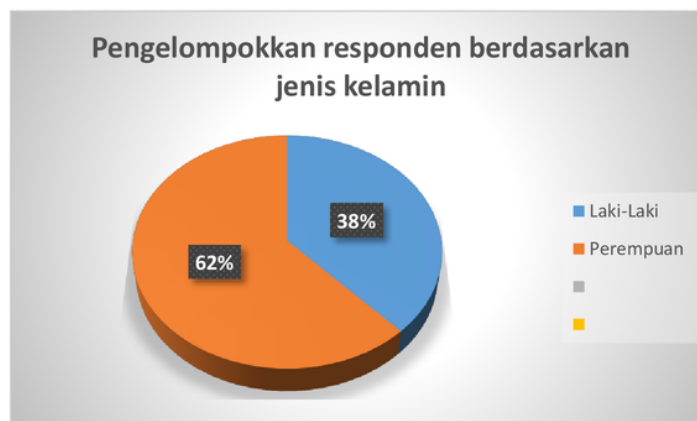
Gambar 4.1 Pengelompokan responden berdasarkan jenis kelamin

Dalam melakukan penyebaran kuisioner pada mahasiswa S-1 Universitas Muhammadiyah Yogyakarta dilakukan oleh peneliti selama 8 hari. Penyebaran kuisioner dilakukan dengan menemui satu-persatu atau bahkan sekelompok mahasiswa yang ada di kampus. Selain menyebarkan kuisioner di kampus, peneliti juga menemui responden ke tempat tinggal mereka. Adapun hasil kuisioner yang diperoleh adalah 100 responden yang kemudian diklasifikasikan pada beberapa karakteristik, yaitu : jenis kelamin, fakultas, disiplin ilmu, angkatan, dan tempat tinggal. Dari karakteristik tersebut, maka data pengklasifikasian responden disajikan peneliti pada gambar berikut ini :