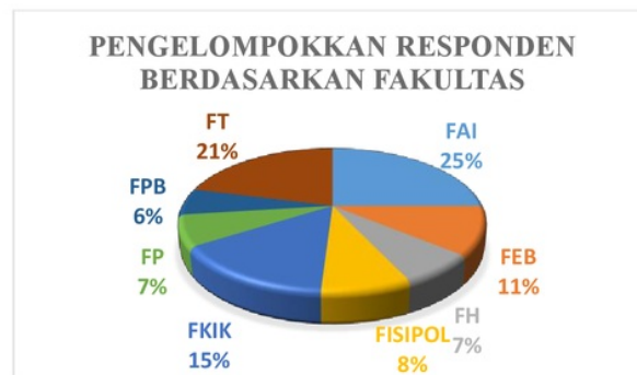
Gambar 4. 2 Pengelompokan responden berdasarkan fakultas

Pada gambar 4.2, pengelompokan karakteristik responden berdasarkan fakultas dapat dilihat bahwa jumlah mahasiswa yang berasal dari Fakultas Agama Islam (FAI) sebanyak 25% atau 25 orang mahasiswa, Fakultas Ekonomi dan Bisnis (FEB) sebanyak 11% atau 11 orang mahasiswa, Fakultas Hukum (FH) sebanyak 7% atau 7 orang mahasiswa, Fakultas Ilmu Sosial dan Ilmu Politik (FISIPOL) sebanyak 8% atau 8 orang mahasiswa, Fakultas Ilmu Kedokteran dan Ilmu Kesehatan (FKIK) sebanyak 15% atau 15 orang mahasiswa, Fakultas Pertanian sebanyak 7% atau 7 orang mahasiswa, Fakultas Pendidikan Bahasa (FPB) sebanyak 6% atau 6 orang mahasiswa, dan Fakultas Teknik (FT) sebanyak 21% atau 21 orang mahasiswa.