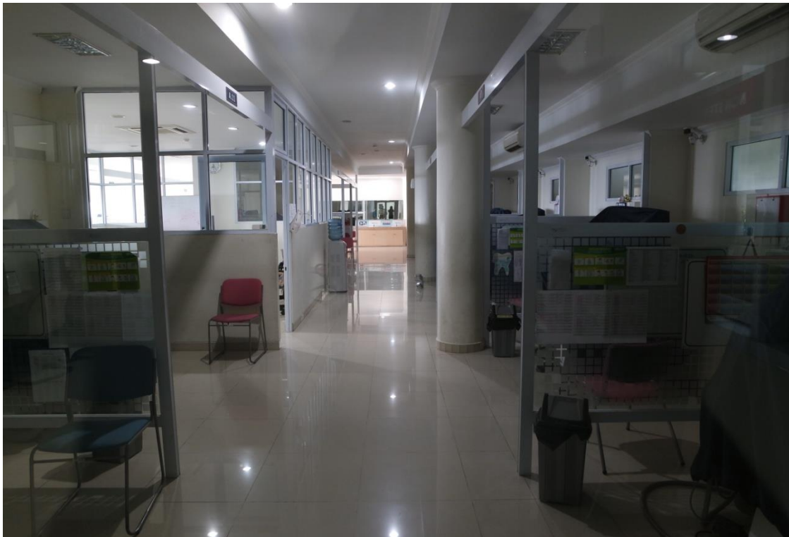
Gambar 6. Pengambilan Sampel Mikrobiologi Udara Pada Ruang Perawatan Gigi Dan Mulut RSGM UMY