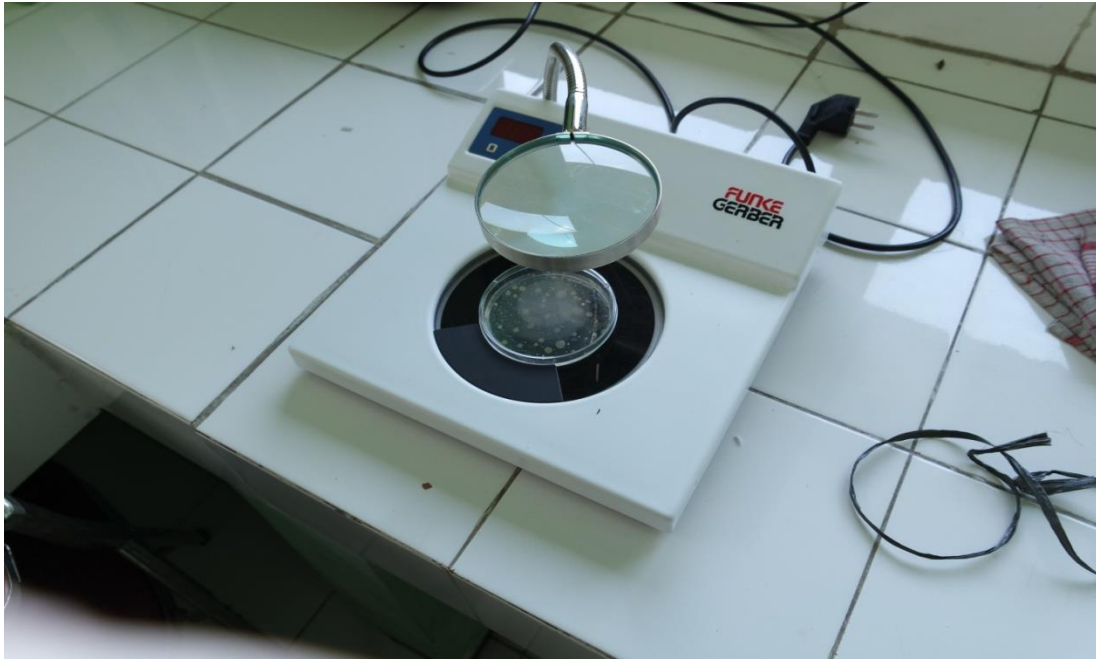
Gambar 5. Colony Counter