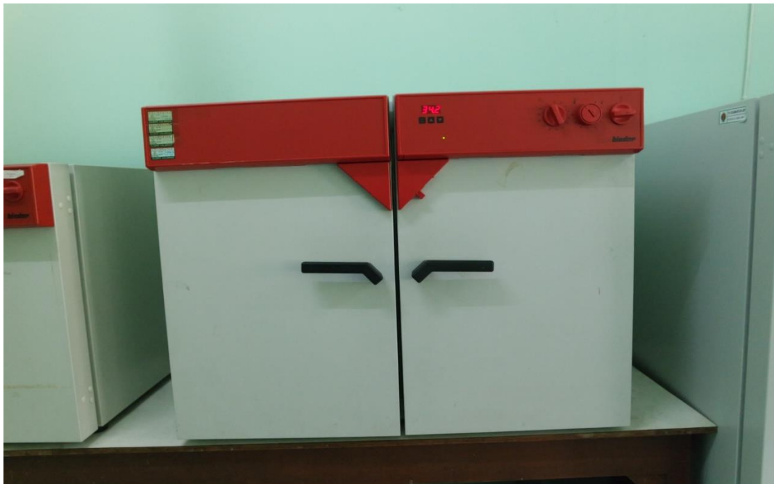
Gambar 4. Inkubator dengan suhu 34,2 0 C