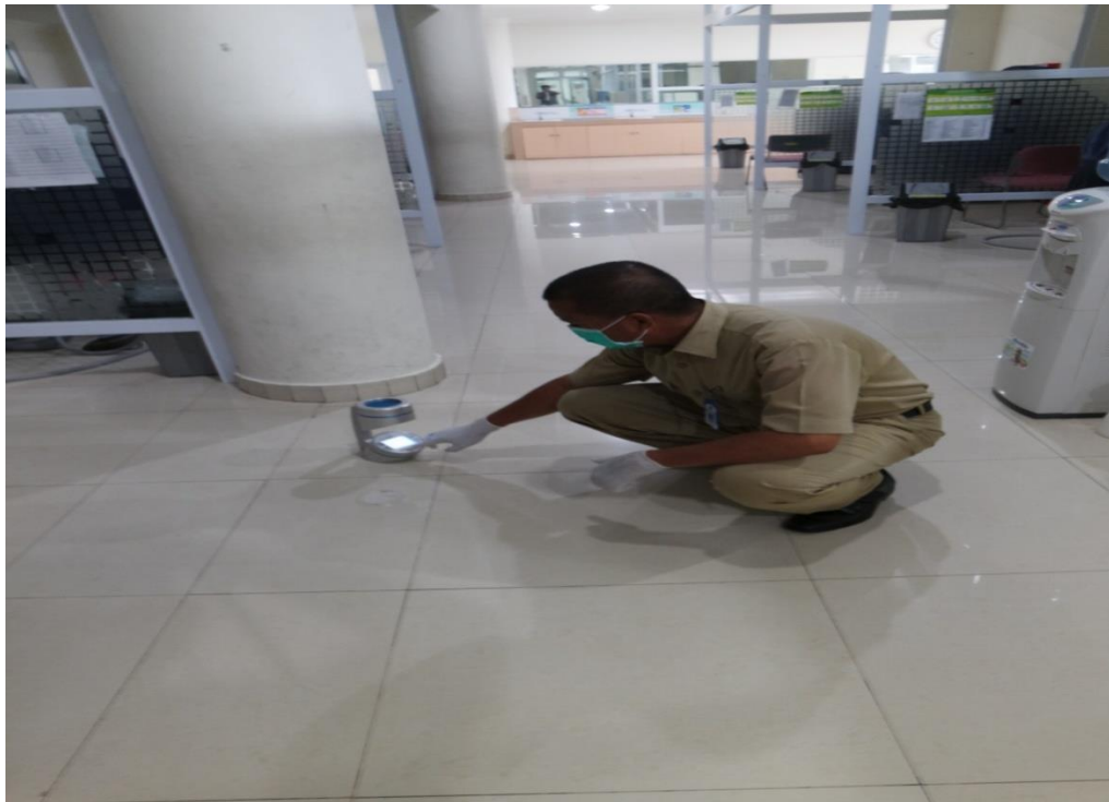
Gambar 1. Petugas sedang Mengoperasikan Alat Mikrobiologi Air Sampler