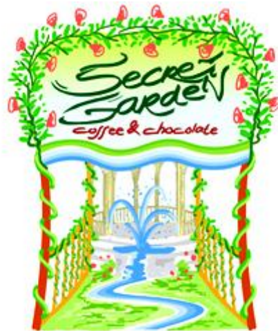
Gambar 2.2 Logo Secret Garden Yogyakarta

Contoh desain logo yang di gunakan Secret Garden Yogyakarta