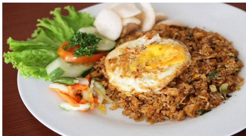
Gambar 3.1 Nasi Goreng Spesial