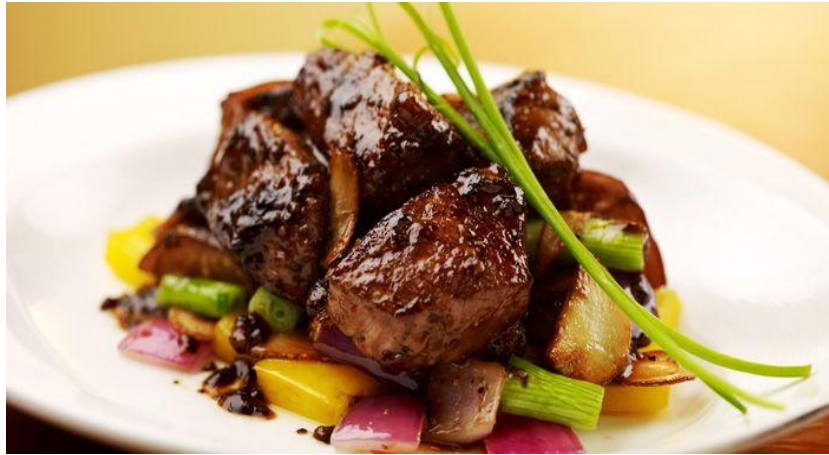
Gambar 2.7 Beef Steak Black Papper