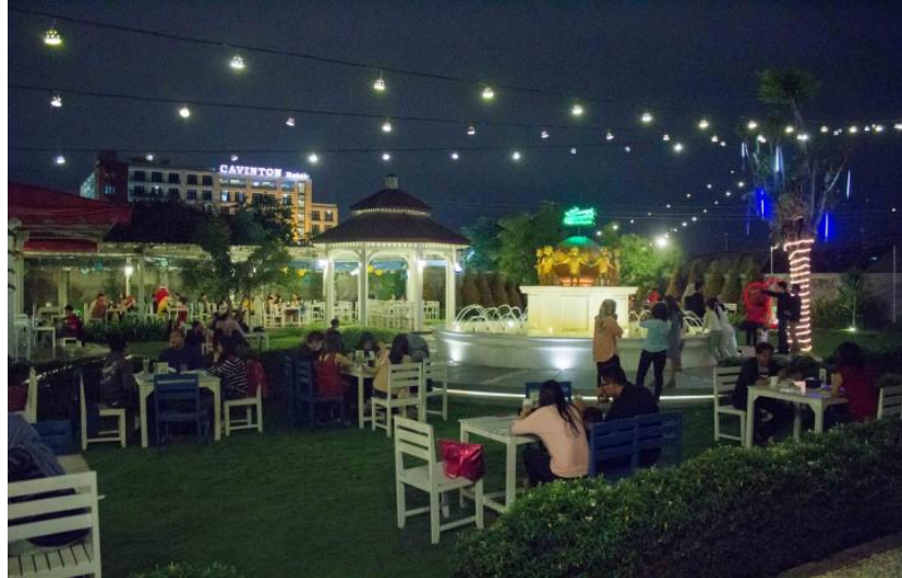
Gambar 2.5 Interior Secret Garden