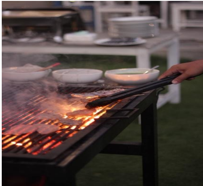
Gambar 3.0 Beef Barbeque