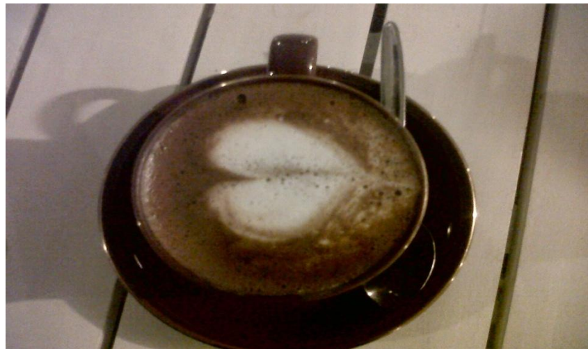
Gambar 3.3 Chocolate Secret Original