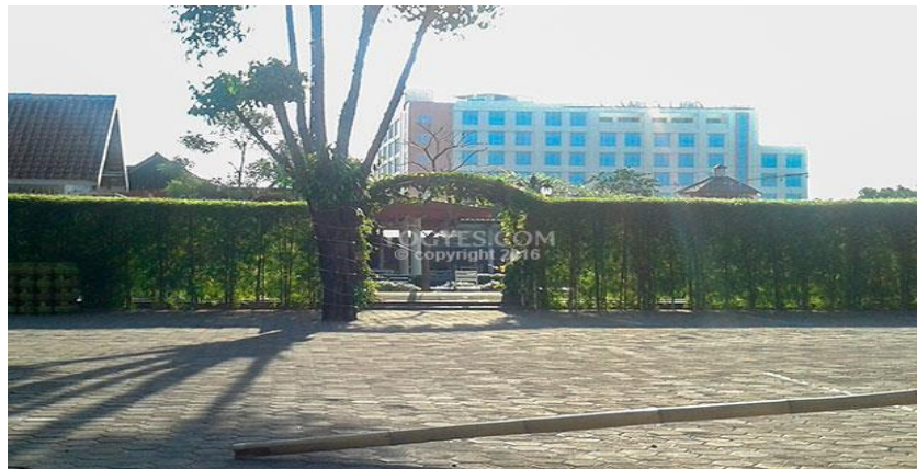
Gambar 2.6 Exterior Secret Garden