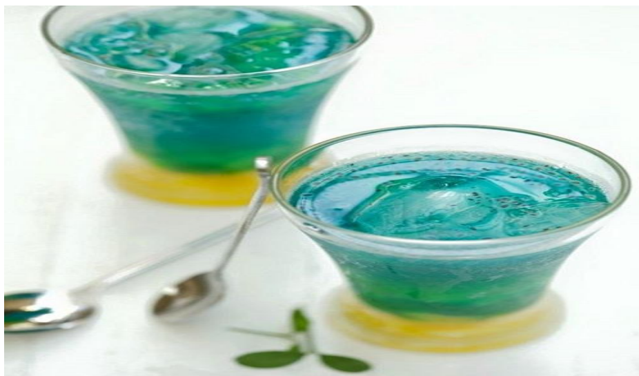
Gambar 3.4 Mocktail Blue Ocean Secret