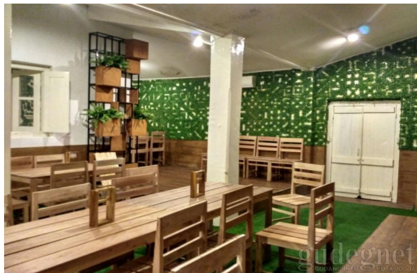
Gambar 2.4 Interior Secret Garden