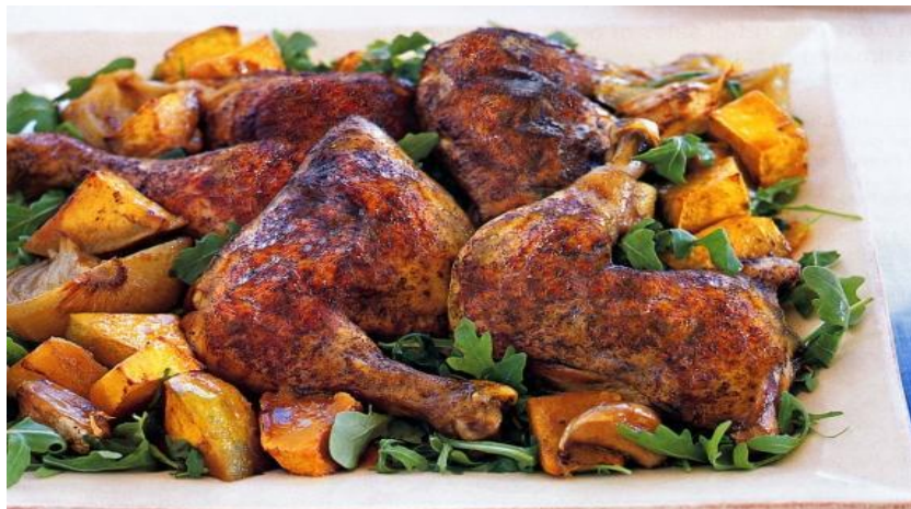
Gambar 2.9 Chiken Maryland