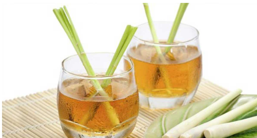
Gambar 3.5 Wedang Jahe Secret

(Sumber : Dokumen Secret Garden Yogyakarta)