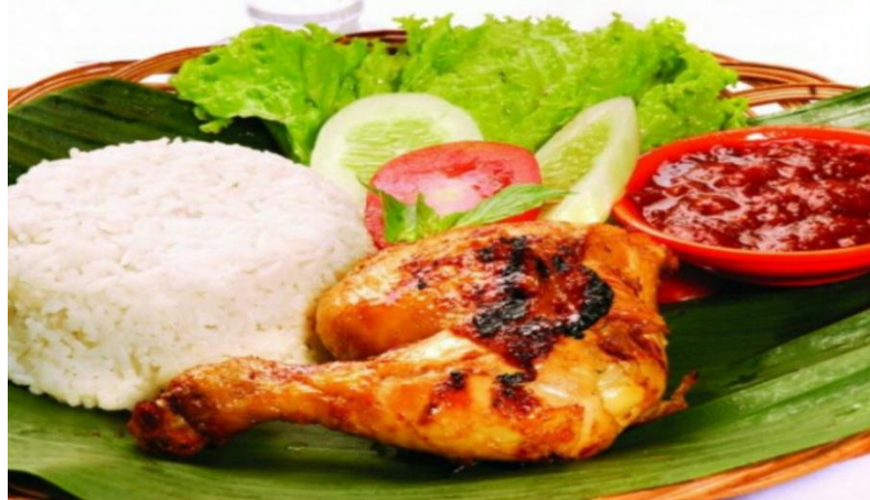
Gambar 3.2 Ayam Lalapan