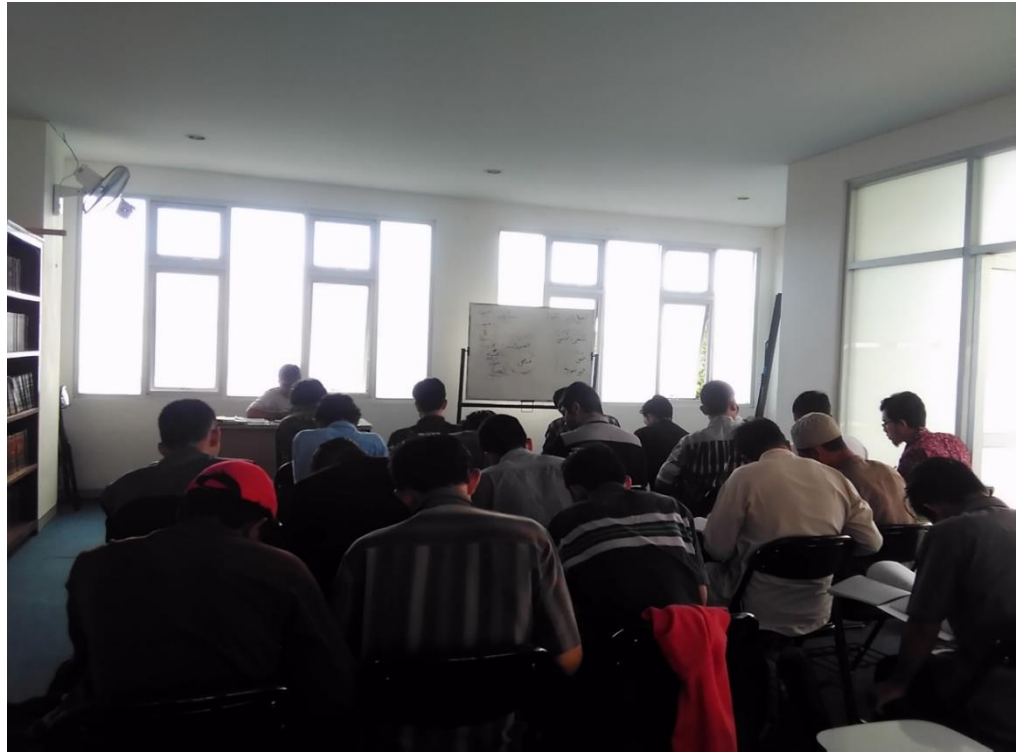
Gambar.7 Kegiatan pembelajaran di kelas Al-Mustawa Al-Awwal dalam mata kuliah At-Tahriry