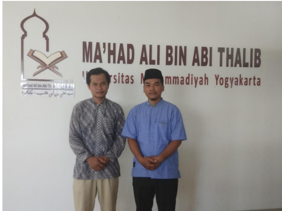
Gambar.2 Foto bersama Direktur Ma'had Ali Bin Abi Thalib