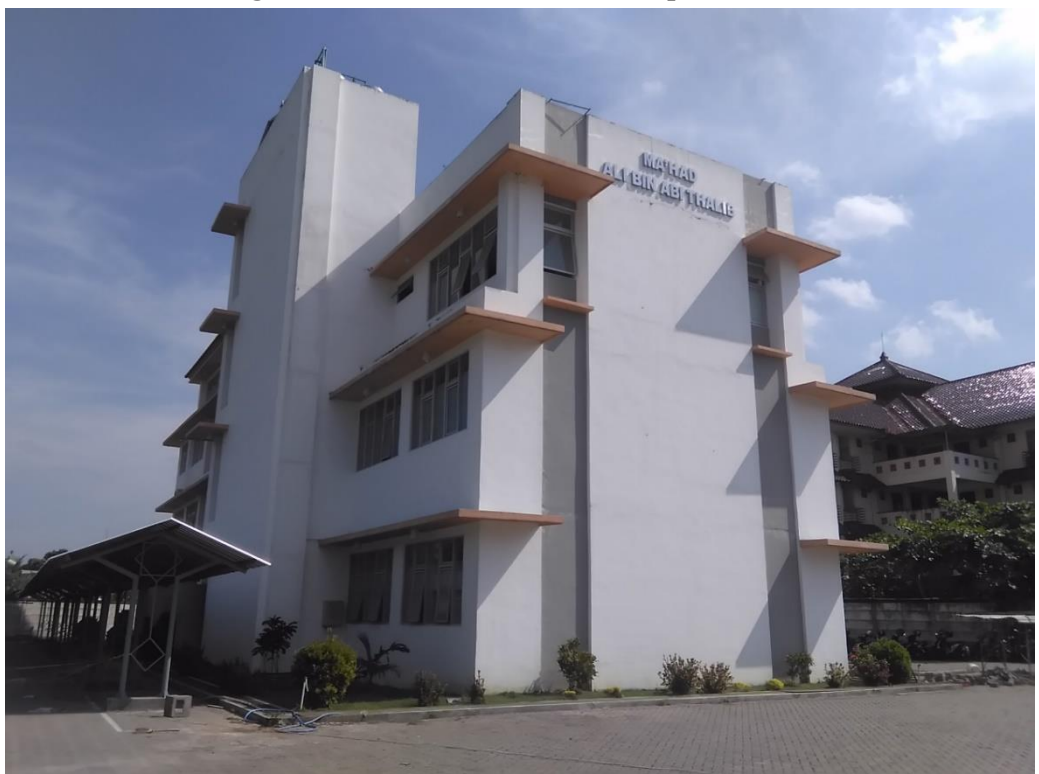
Gambar.10 Gedung Ma'had Ali Bin Abi Tholib tampak dari arah timur