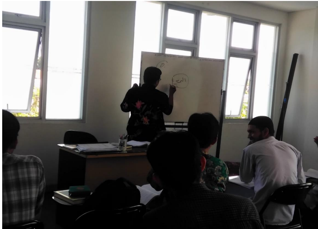
Gambar.5 Kegiatan pembelajaran di kelas Al-Mustawa Al-Awwal dalam mata kuliah At-Tahriry