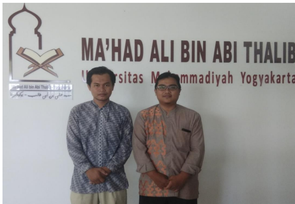
Gambar.3 Foto bersama Dosen Pengampu sekaligus Bagian Kurikulum dan Akademik