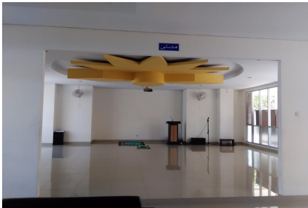
Gambar.8 Mushola Jami'