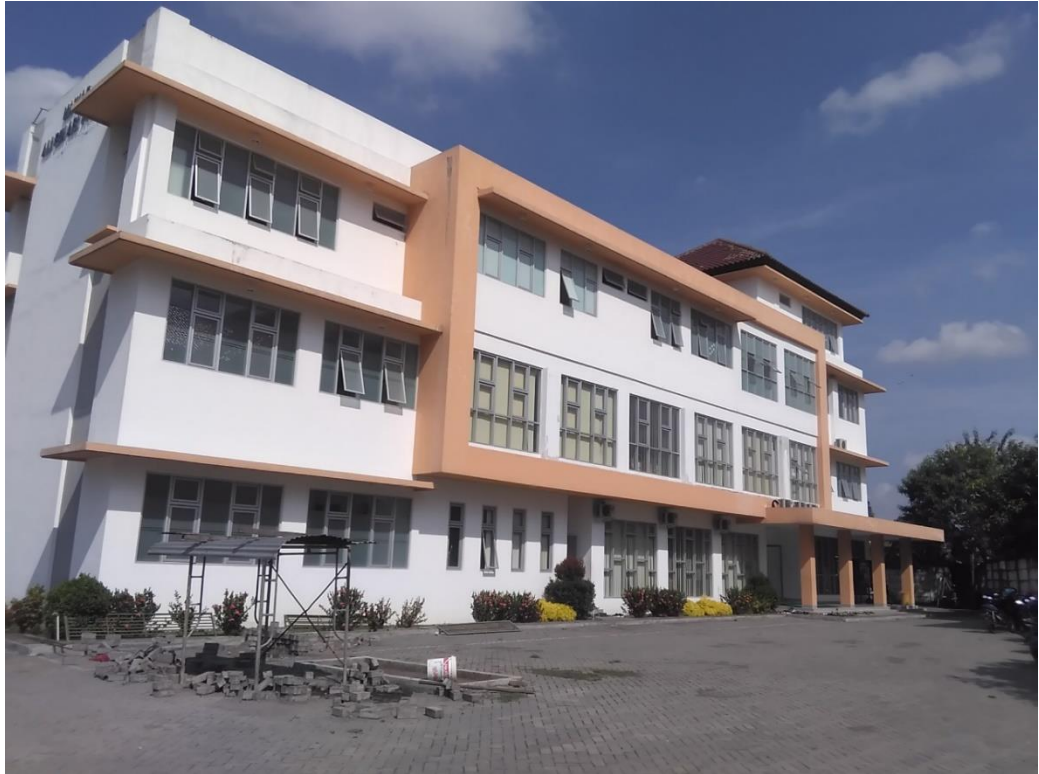
Gambar.9 Gedung Ma'had Ali Bin Abi Tholib UMY tampak dari utara