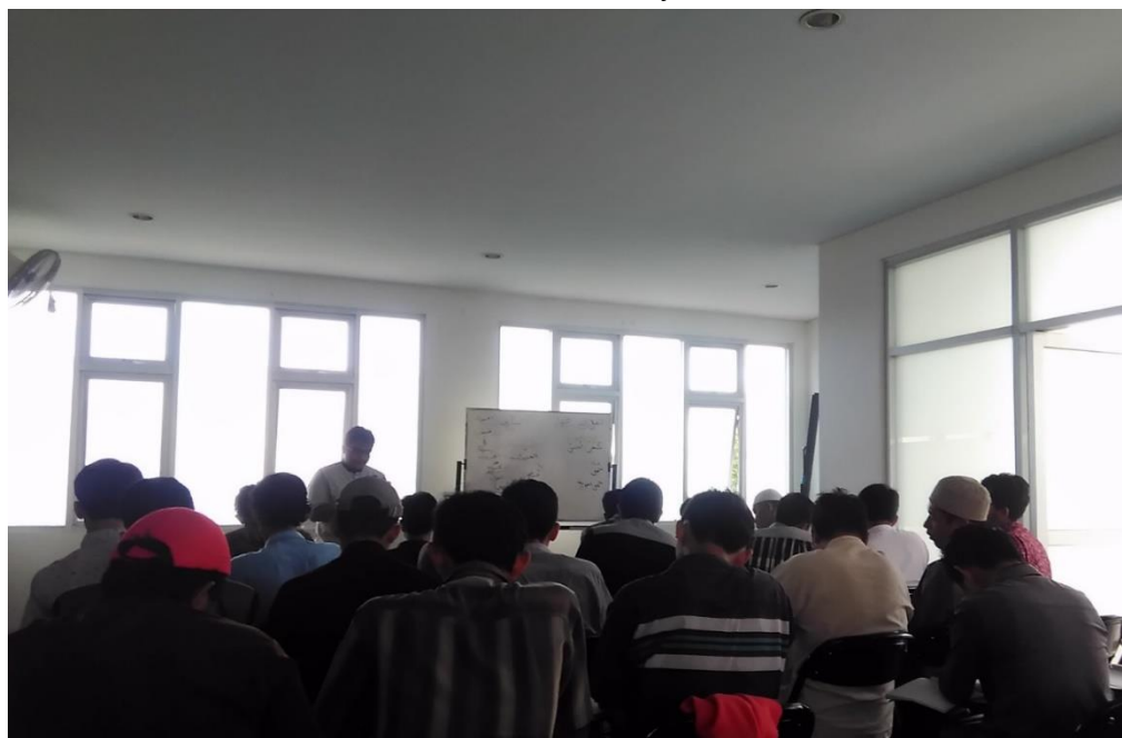
Gambar.6 Kegiatan pembelajaran di kelas Al-Mustawa Al-Awwal dalam mata kuliah At-Tahriry