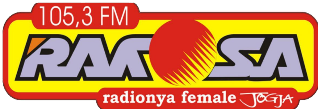
Gambar 1 Logo Rakosa Female Radio 105,3 FM Jogja