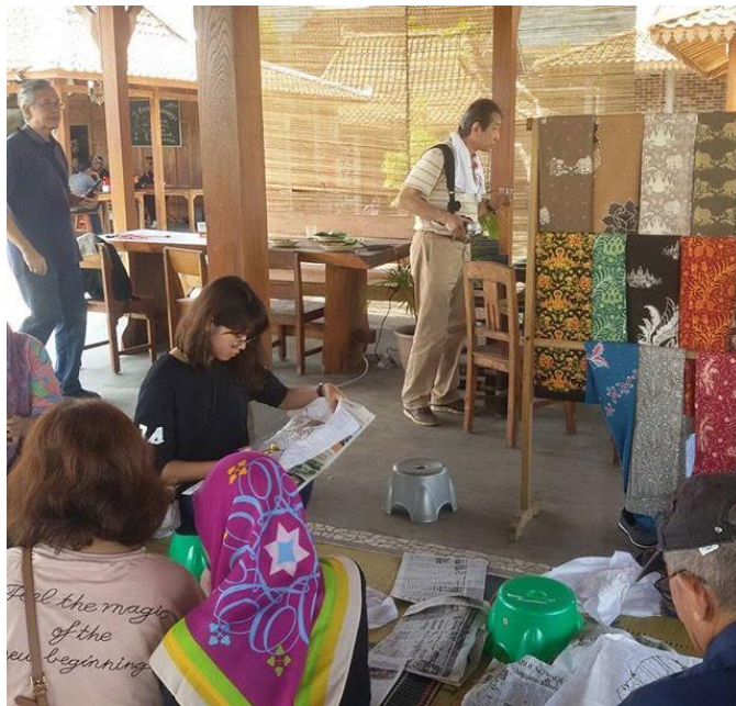
Salah satu UMKM masyarakat Desa Tuksong