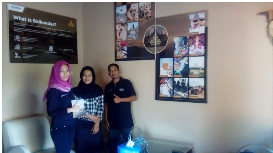
Foto : Supervisor Program PT. Patrajasa dengan peneliti dan karyawan PT. Patra Jasa Lainnya