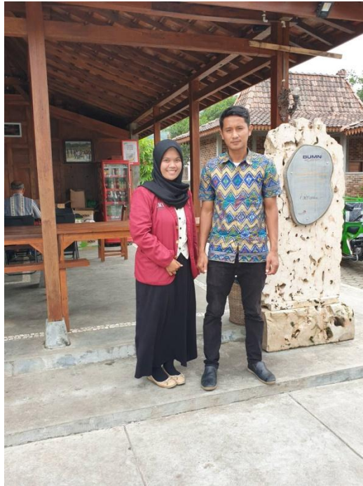
Foto: supervisor balkondes Tuksongo bersama peneliti