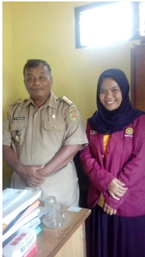
Foto : Kepala Desa Tuksongo Bersama Peneliti