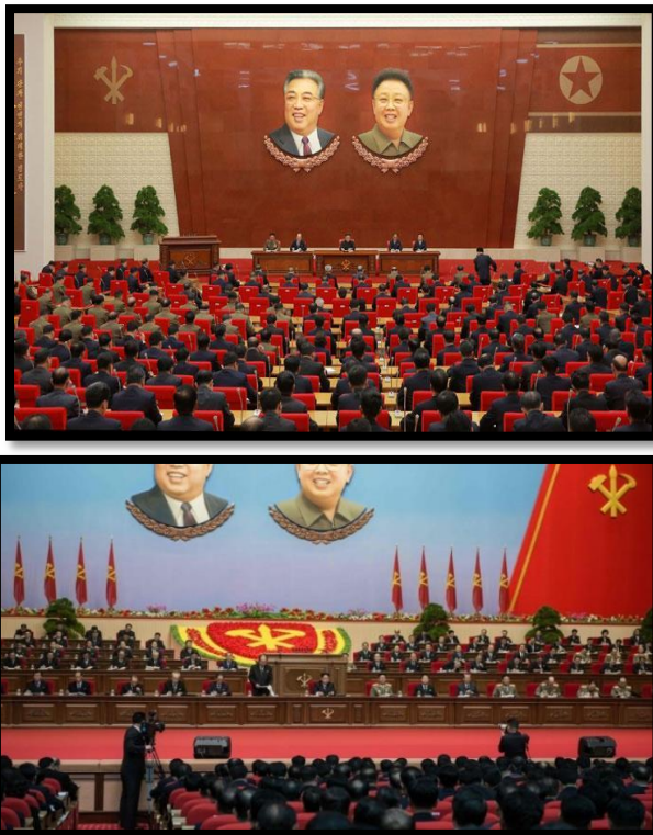
Gambar 3. 1 Suasana Sidang Partai di Korea Utara

abadi". Pola pemerintahan diktator yang di pimpin oleh Kim Il-Sung membawa Korea Utara menekankan pada pola pembangunan yang sama dengan Uni Soviet yakni terpusat dan taat pada rencana pembangunan. Negara memiliki semua sektor industri dan agrikultur, sementara semua bisnis dan industri swasta dihapus pada tahun 1950an. Negara mengumpulkan semua komoditas dan mendistribusikannya, hingga semua alokasi makanan, pakaian, dan kebutuhan dasar masyarakat didistribusikan dari pusat. 52