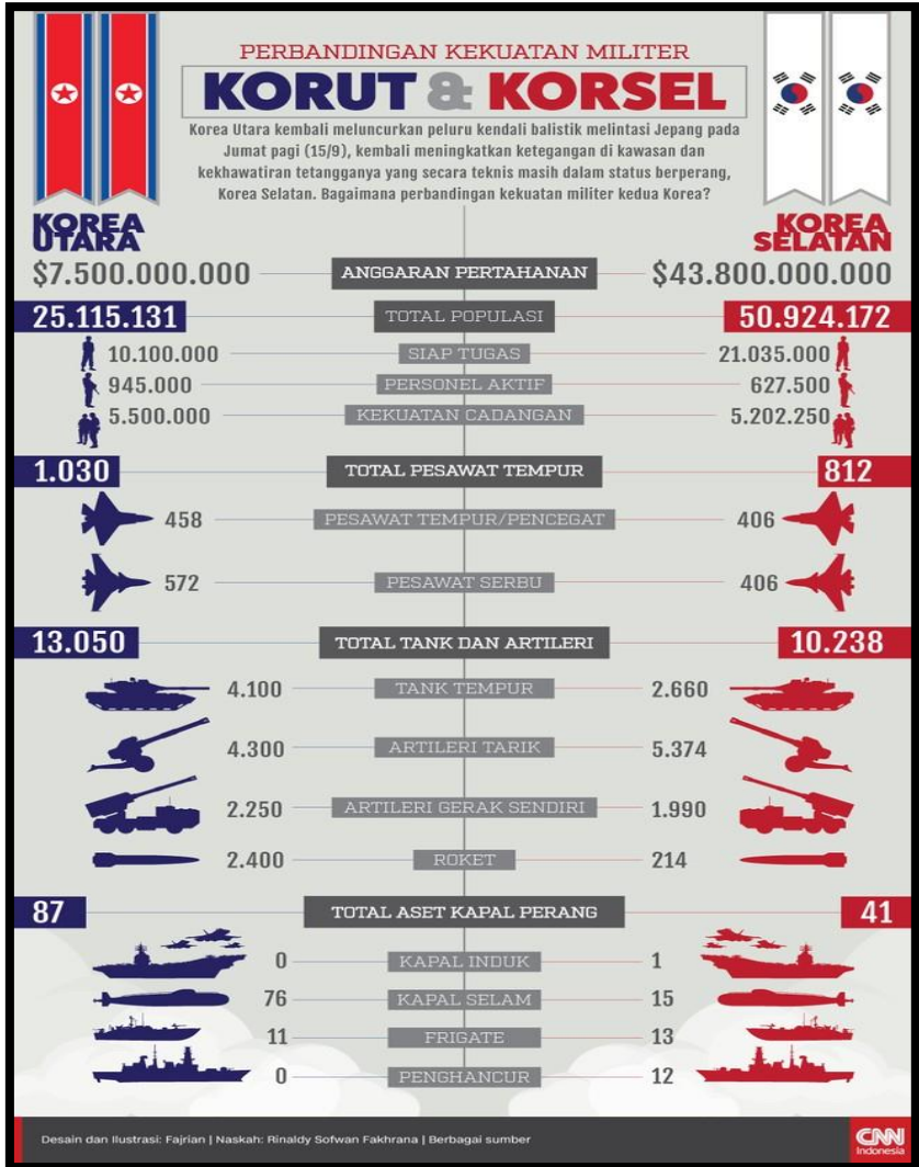
Gambar 3. 2 Perbandingan Kekuatan Militer Korut dan Korsel