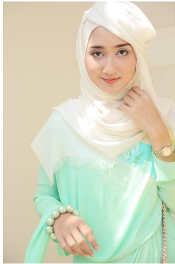
Gambar 2.9 Dian Pelangi