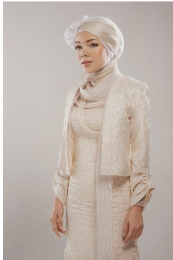
Gambar 2.5 Dewi Sandra