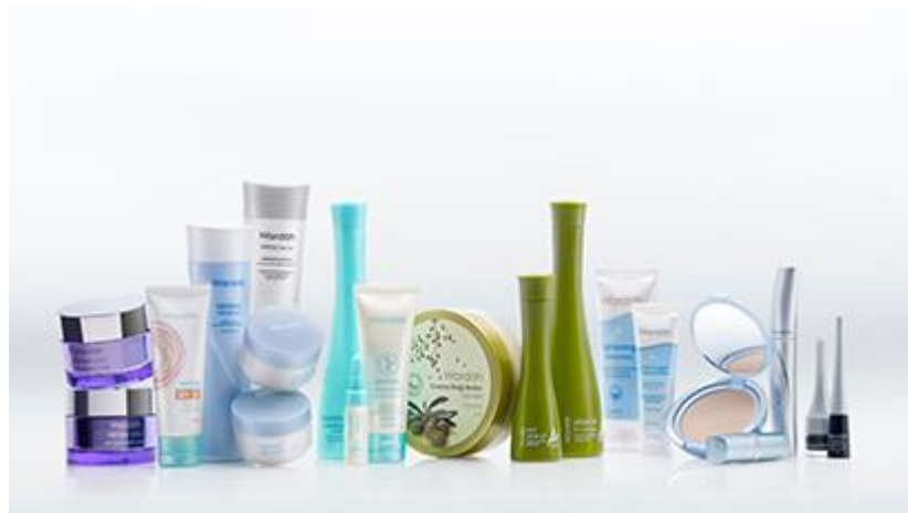
Gambar 2.3 Beberapa Produk Wardah

Untuk produk Wardah itu sendiri, terbagi atas 4 jenis yaitu: skin care, body series, make up, dan hajj umrah. Adapun penjelasannya sebagai berikut (Rizaldi, 2017)