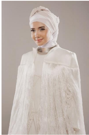
Gambar 2.7 Zaskia Sungkar