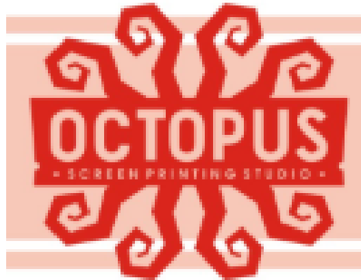
Gambar 2.1 Logo Octopus Studio Printing