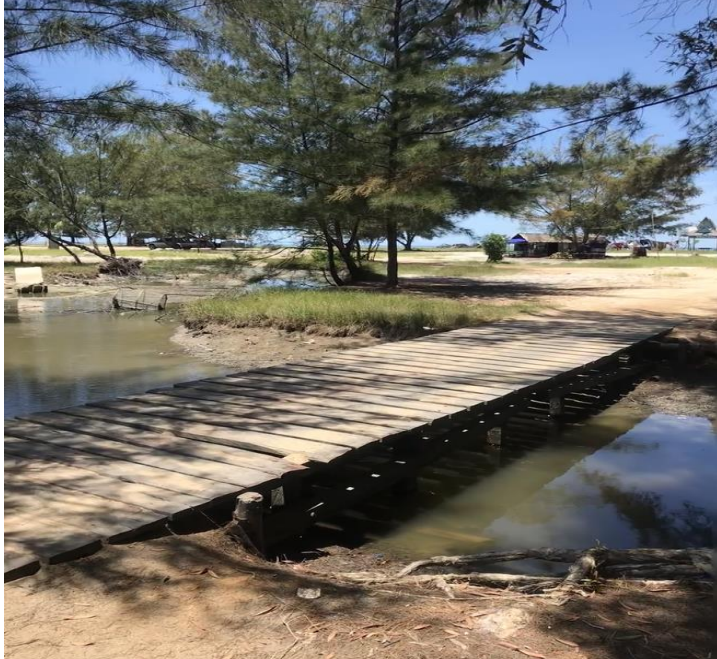
Lampiran 7. Pemakaman Sultan ke II Kabupaten Kotawaringin Barat