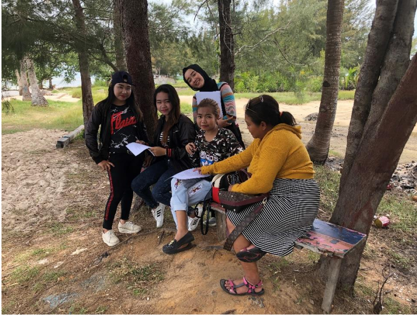
Lampiran 5. Pemberian kuisisioner kepada responden masyarakat