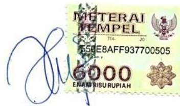
Hilza Iva Anggraini Syawie

Yogyakarta, 13 September 2019 Yang Membuat Pernyataan