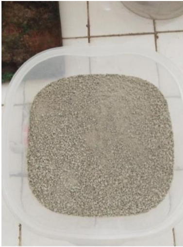
Zeolit sebelum diayak