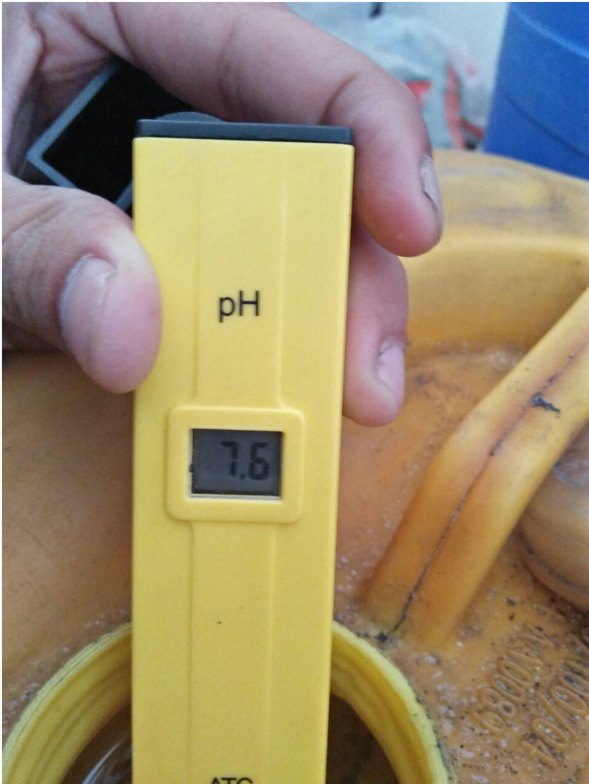
Ph pada Air laut