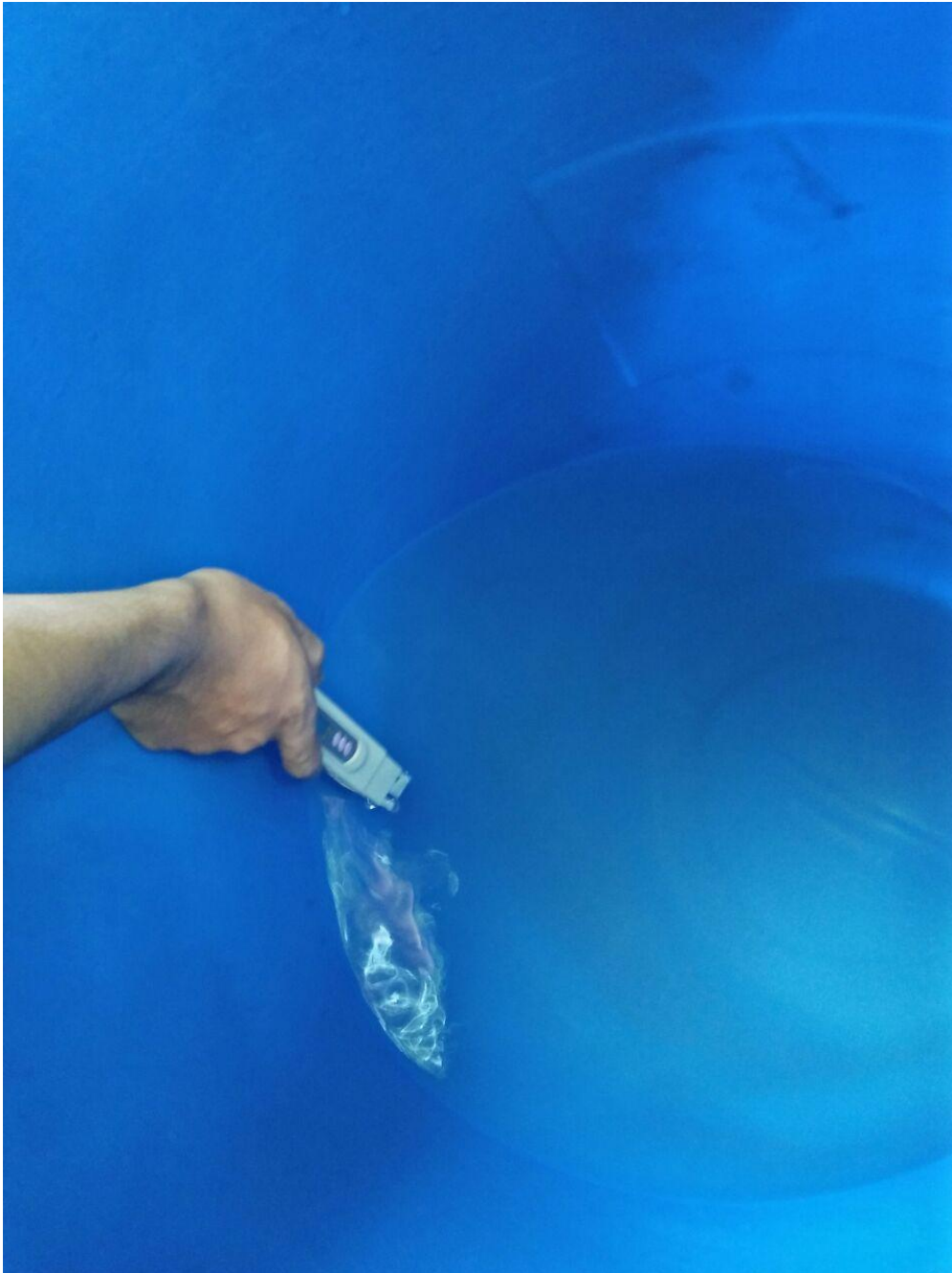
Pengujian TDS Air Laut