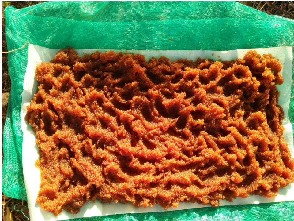
Proses Penjemuran Resin