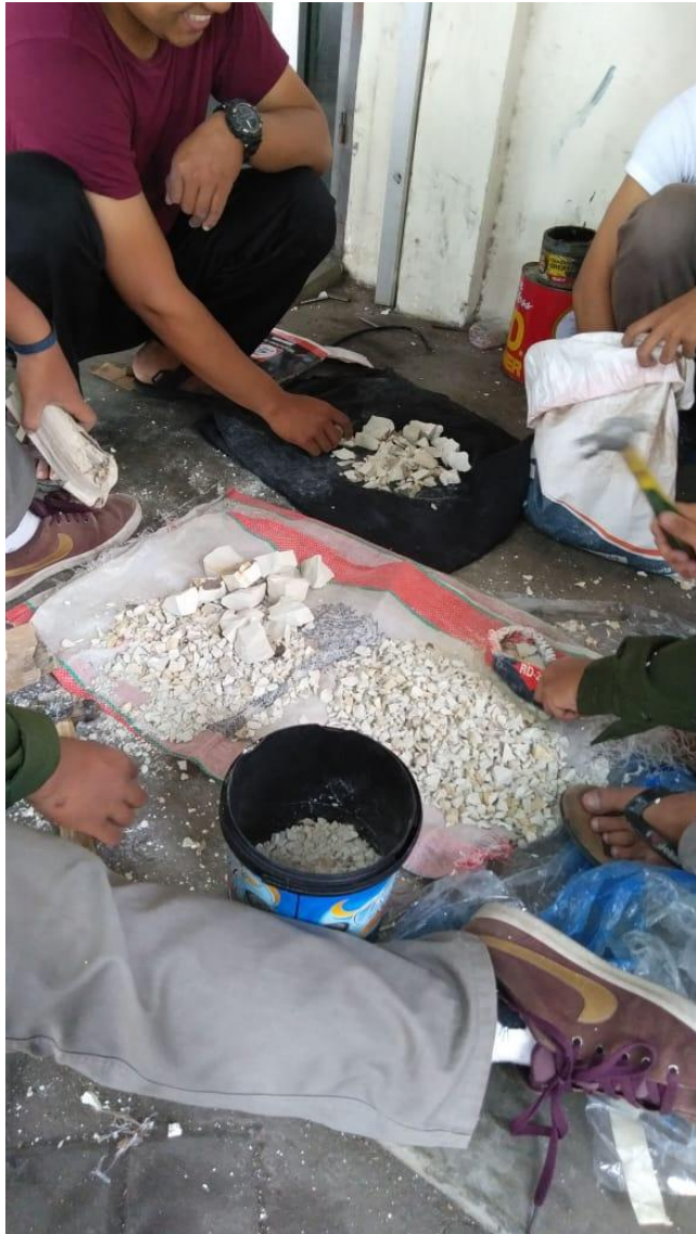
Proses Pemecahan Batu Zeolit