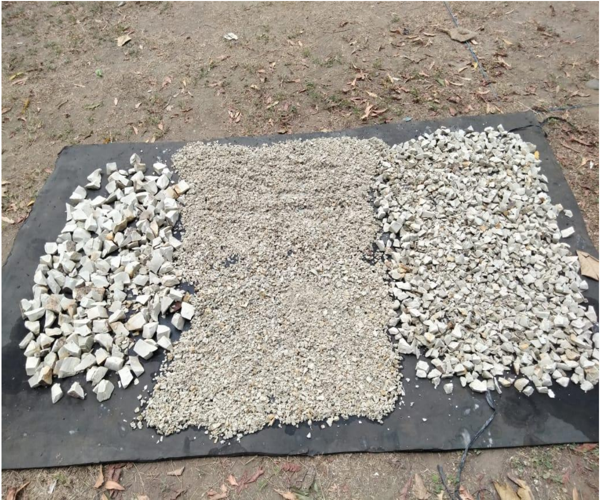
Penjemuran bahan Filtrasi