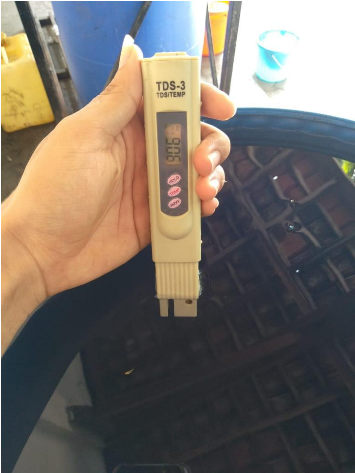
Hasil Pengukuran TDS Proses Ionisasi dan Filtrasi