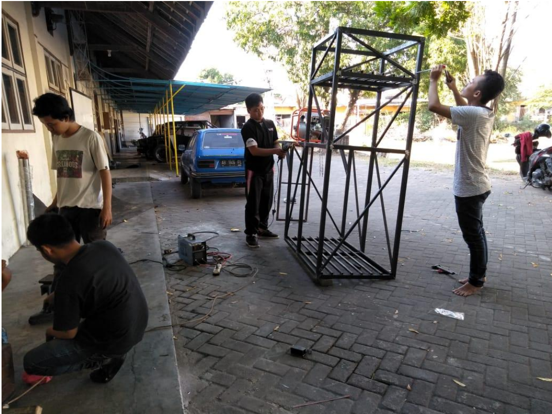
Persiapan Kerangka Pengolahan Air Laut