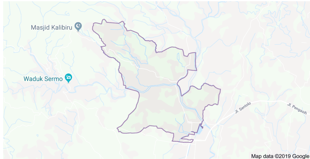
Gambar 2.1 Peta Wilayah Desa Sendangsari