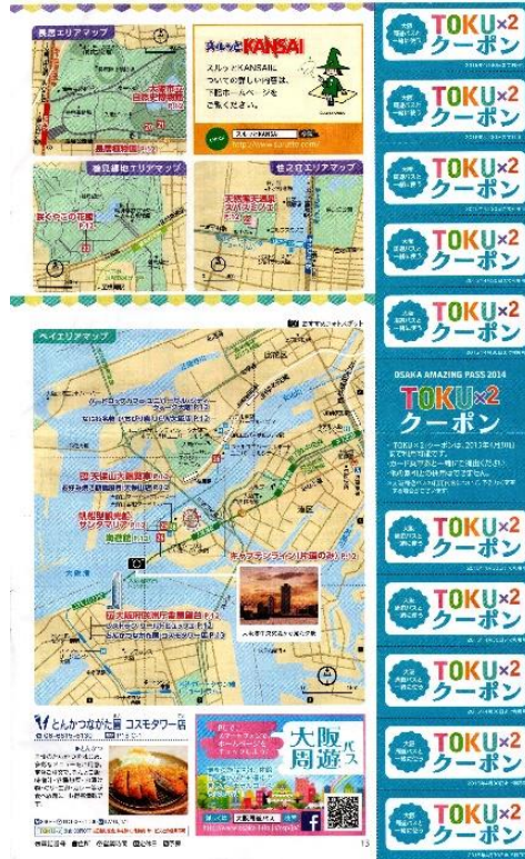
Katalog berisi Wacana