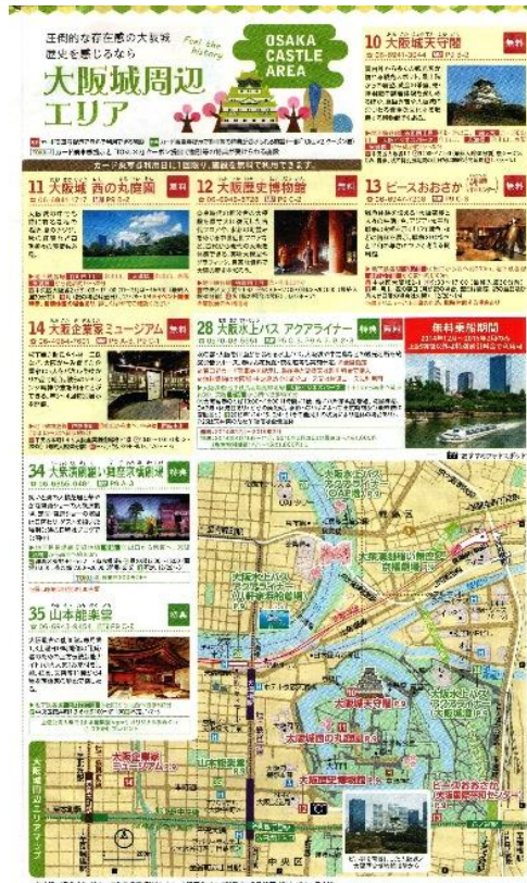
Katalog berisi Wacana