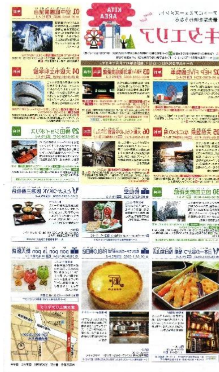
Katalog berisi Wacana