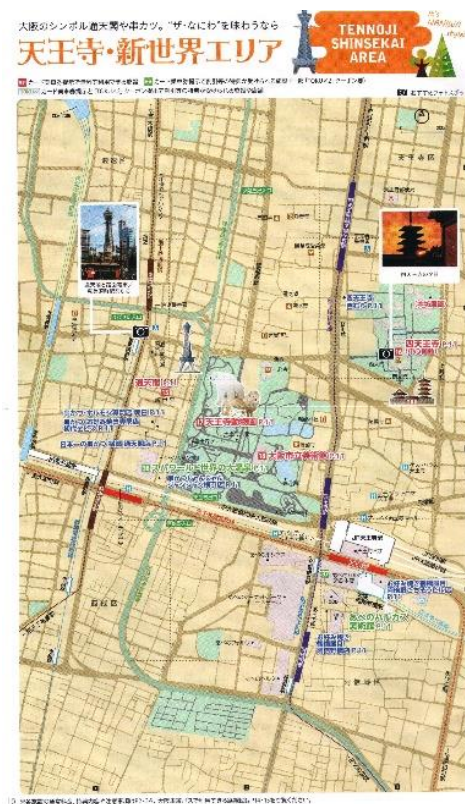
Katalog berisi Jalur Kereta