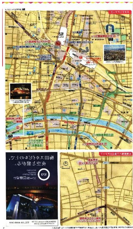
Katalog berisi Jalur Kereta