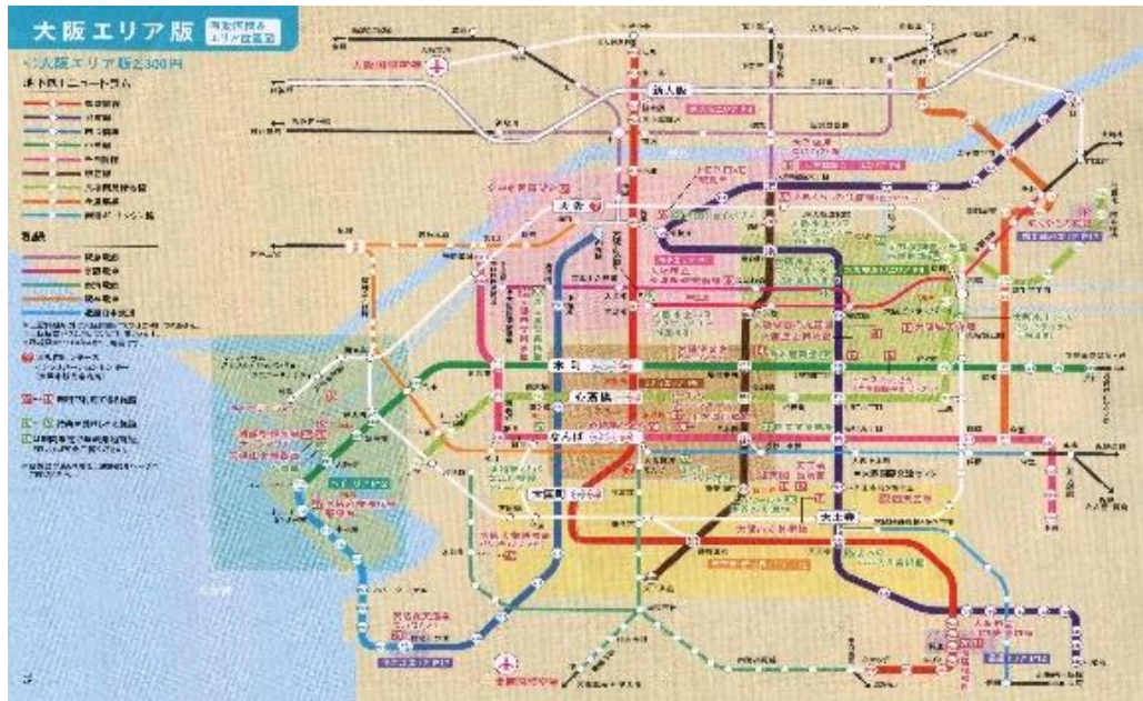
Peta Jalur Kereta