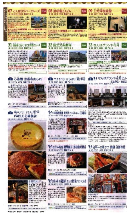
Katalog berisi Wacana