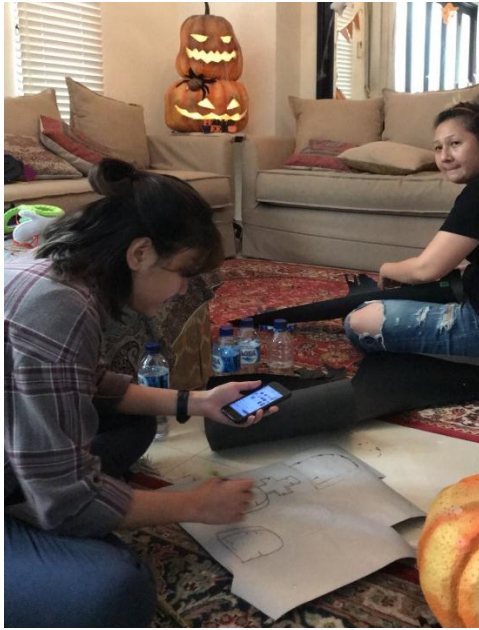
Proses pembuatan properti shooting .