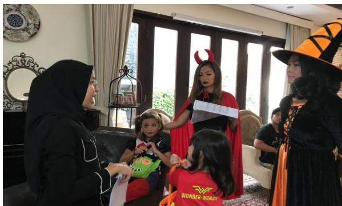
Proses briefing talent saat shooting