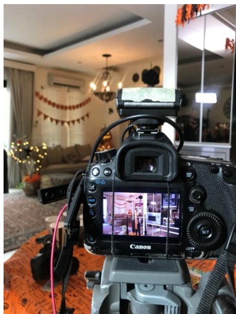
Proses pengambilan gambar saat shooting .