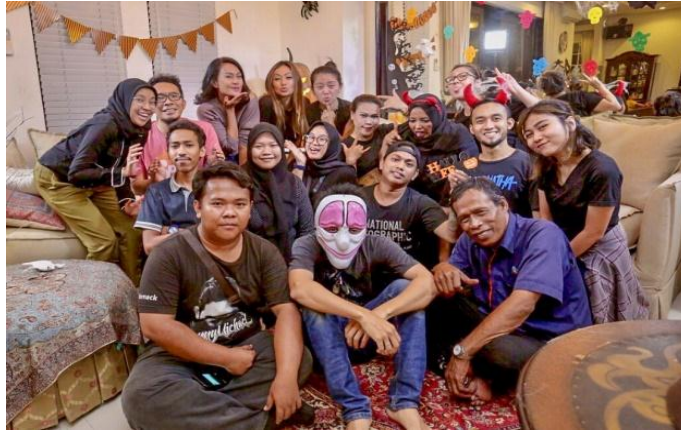
Foto bersama kru Mom Squad NET.