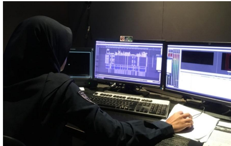
Proses editing di booth editing online