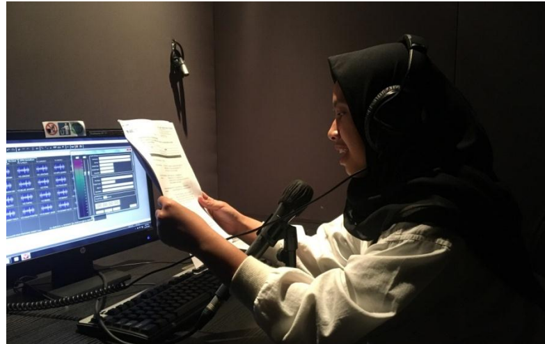
Proses take voice over