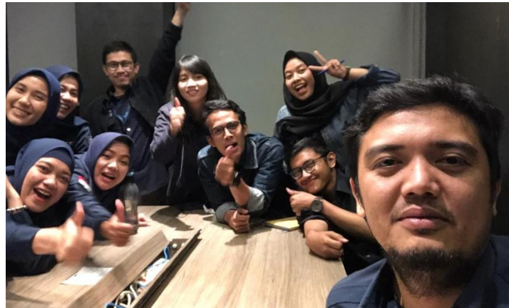
Proses brainstorming ide