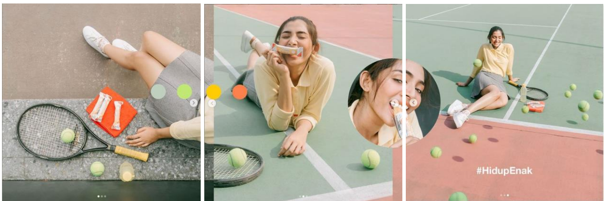
Gambar 2.9 – 2.11 : Iklan Soyjoy Edisi Tennis Versi @dianrockmad