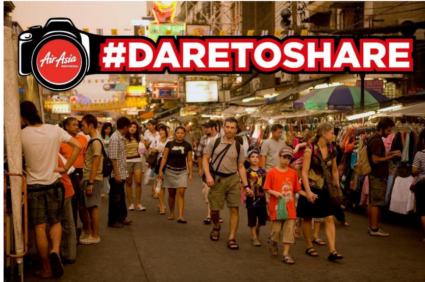
Gambar 2.12 : Poster Air Asia Indonesia #DareToShare 2014

Bayu juga sering mengikuti kompetisi foto dan memenangkan banyak hadiah menarik, diantaranya mendatangi tempat-tempat yang belum pernah ia datangi sebelumnya. Kompetisi pertama yang dimenangkan Bayu adalah AirAsia Indonesia #DareToShare Photo Contest year 2014.