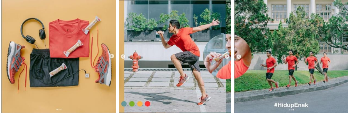
Gambar 2.6 – 2.8 : Iklan Soyjoy Edisi Jogging Versi @dianrockmad

Bayu juga kerap membuat konten untuk brand dengan gaya yang sangat khas dari @dianrockmad yaitu #igseamlesspost dan #swipekanankiriasyik.