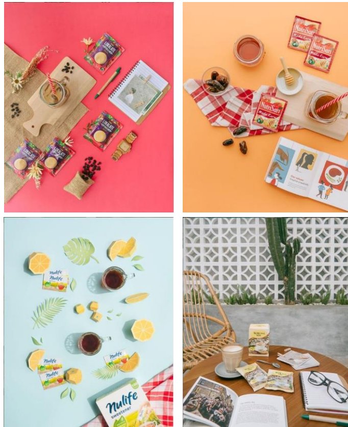
Gambar 2.2 – 2.5 : Beberapa hasil karya @dianrockmad

Seiring berjalannya waktu, Bayu mulai mendapat banyak tawaran untuk membuat konten beberapa brand, baik itu brand yang sudah mempunyai nama besar maupun yang baru merintis. Brand-brand itu diantaranya seperti W'dank Lokalate, Enzim, Wrangler, ImageryBags, OFFF.co, Portegoods, Oorth, Gofast, O-smile Dental, Tropicana Slim, L-men, Yats Colony, Telkomsel simPATI, Aqua, Nulife, Tokopedia, Minute Maid, Hotel CiputraSemarang, IDNSoundscape, GO-JEK, Shopee, Spotify, Indonesia Stock Exchange, FilKop2, Mountoya, UBER, Telkomsel TCASH, Bonolo, Broodis, Roepi, MLDSpot, Wandersnap, Achilles Radial, Happy Socks, Samsung NX.