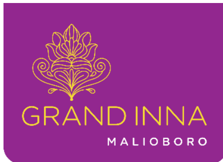
Gambar 2.2 Logo Grand Inna Malioboro