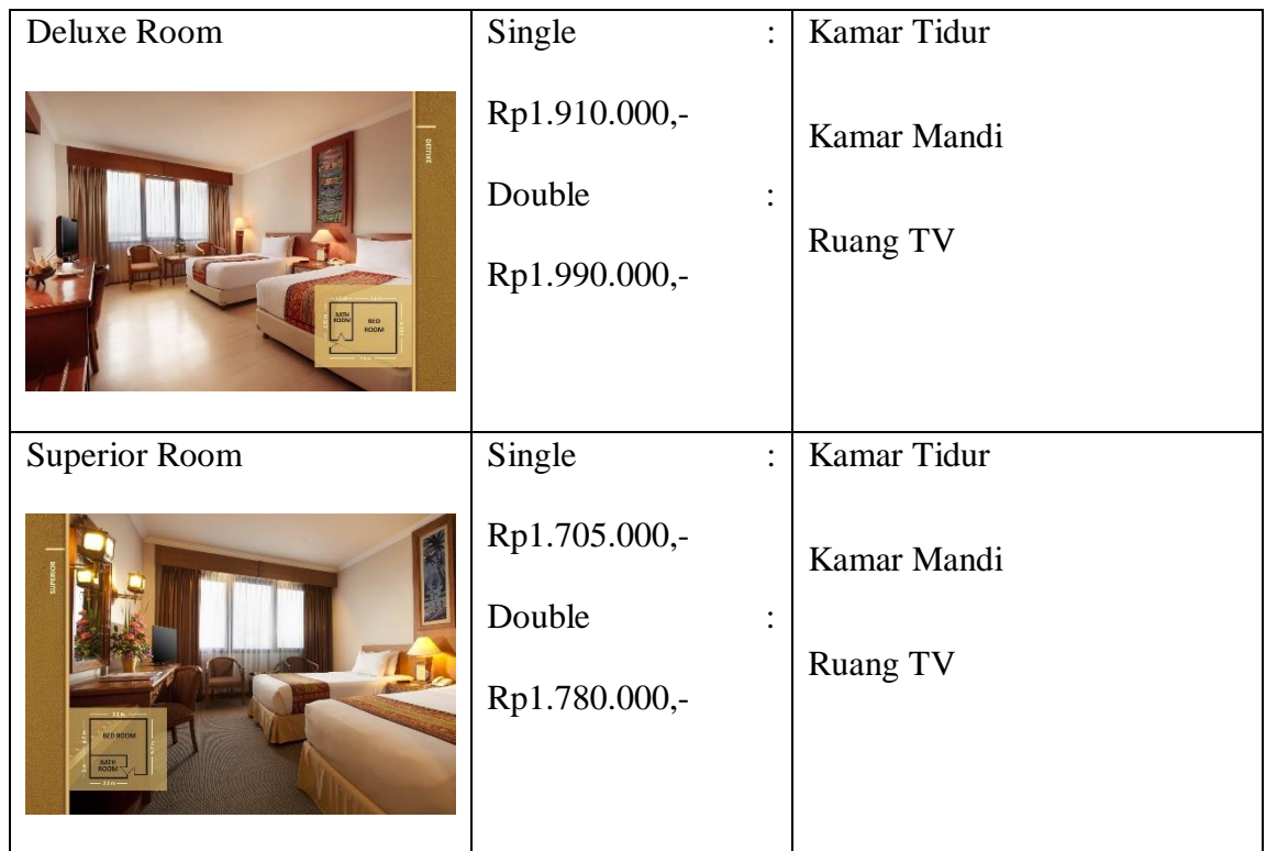
Tabel 2.1 Tipe Kamar dan Harga Publish Rates Sumber: Dokumen Internal Grand Inna Malioboro 2019