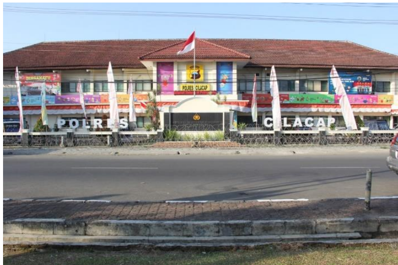
Gambar 2. Kantor Kepolisian Resor Cilacap