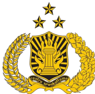
Gambar 1. Logo Tribrata