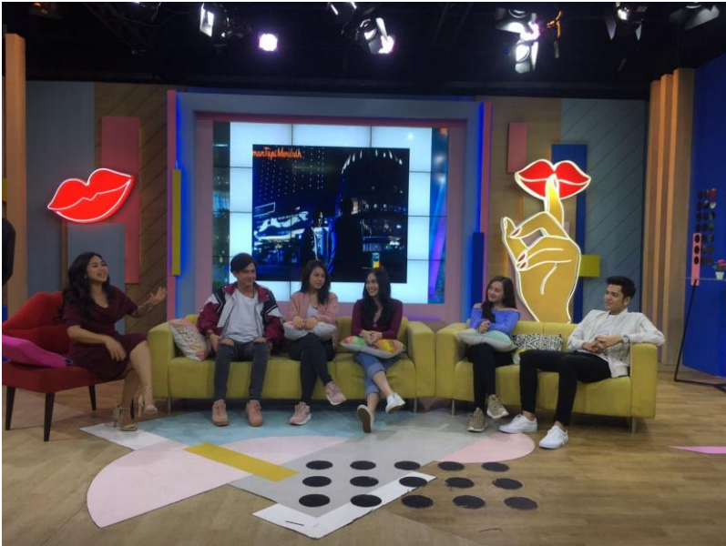
Studio Rumpi (No Secret)