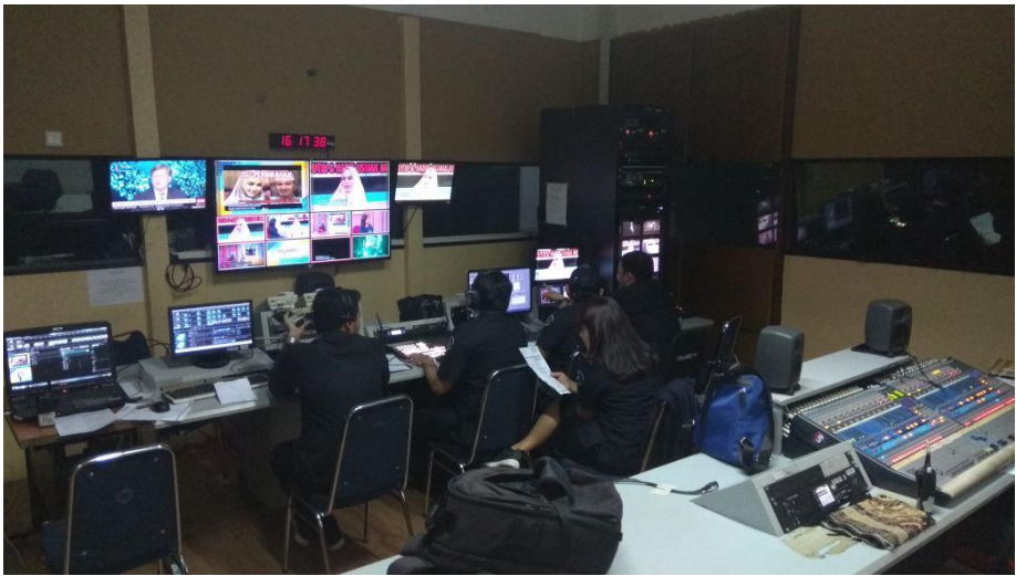
Control RoomRumpi No Secret()