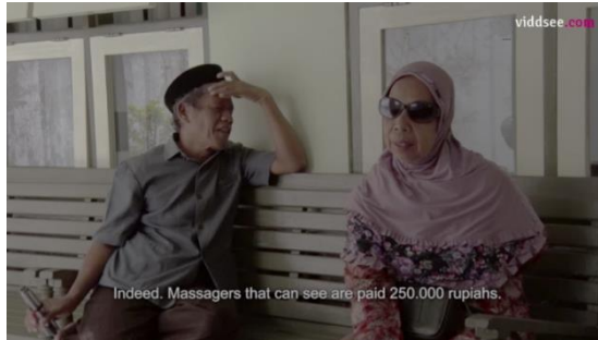
Gambar 3.2.1 Dua anggota distra budaya yang sedang mengeluh dengan adanya pijat online dengan tarif yang lebih tinggi dari mereka.

Dalam makna denotatif , digambarkan dua orang anggota distra budaya sedang duduk santai dan mengobrol di bangku kursi di luar ruangan (signifier). Mereka sedang membicarakan keberadaan pijat refleksi online yang mulai marak di masyarakat. Mereka sama-sama mengeluh dengan keberadaan pijat refleksi online, keberadaan mereka bisa merebut pelanggan mereka (signified).