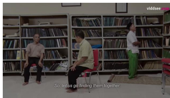
Gambar 3.3.1 Anggota distra budaya sedang beribadah di antara anggota lain yang sedang berlatih ketoprak

Pada denotatif gambar 3.3.1 adalah sebuah tampilan gambar yang menunjukkan suasana kelompok distra yang sedang berlatih ketoprak disebuah ruangan tempat biasa anggota distra berlatih ketoprak. Di samping Distra berlatih drama ketoprak terlihat